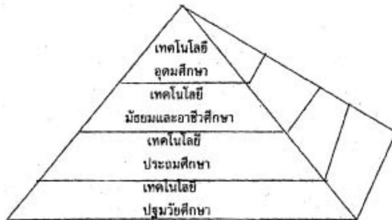
ภาพที่ 2 การแบ่งเทคโนโลยีการศึกษาในแนวตั้ง

เทคโนโลยีการศึกษาในแนวนอน แบ่งได้ 3 ระบบ คือ