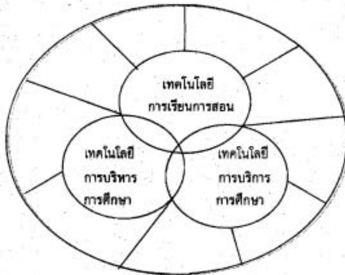
ภาพที่ 3 ความสัมพันธ์ขององค์ประกอบของเทคโนโลยีการศึกษาในแนวนอน

ดังนั้น เทคโนโลยีการศึกษาสามารถแบ่งตามรูปแบบในทางแนวดิ่งและแนวนอนได้ 12 ประเภท คือ