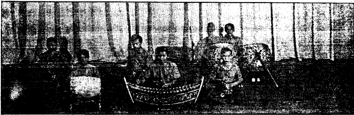
วงปี่พาทย์เครื่องเล็ก หรือปี่พาทย์เครื่องห้า

ภาพวงปี่พาทย์ จากหนังสือ "เครื่องดนตรีไทย"