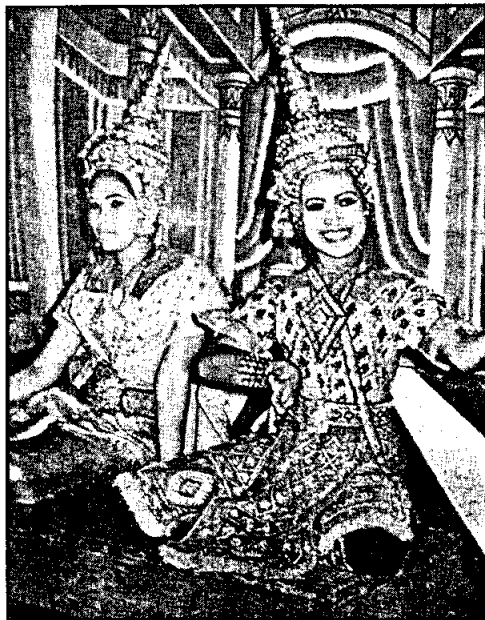
ละครชาติ กษัตริย์หรือหิรัญ จังหวัดอยุธยา เรื่อง "โกมินทร์" ๒๕๒๐

รูปโรงละครและตัวละครชาติ จากหนังสือวรรณกรรมประกอบการเล่นละครชาติ. โครงการเผยแพร่เอกลักษณ์ของไทย.