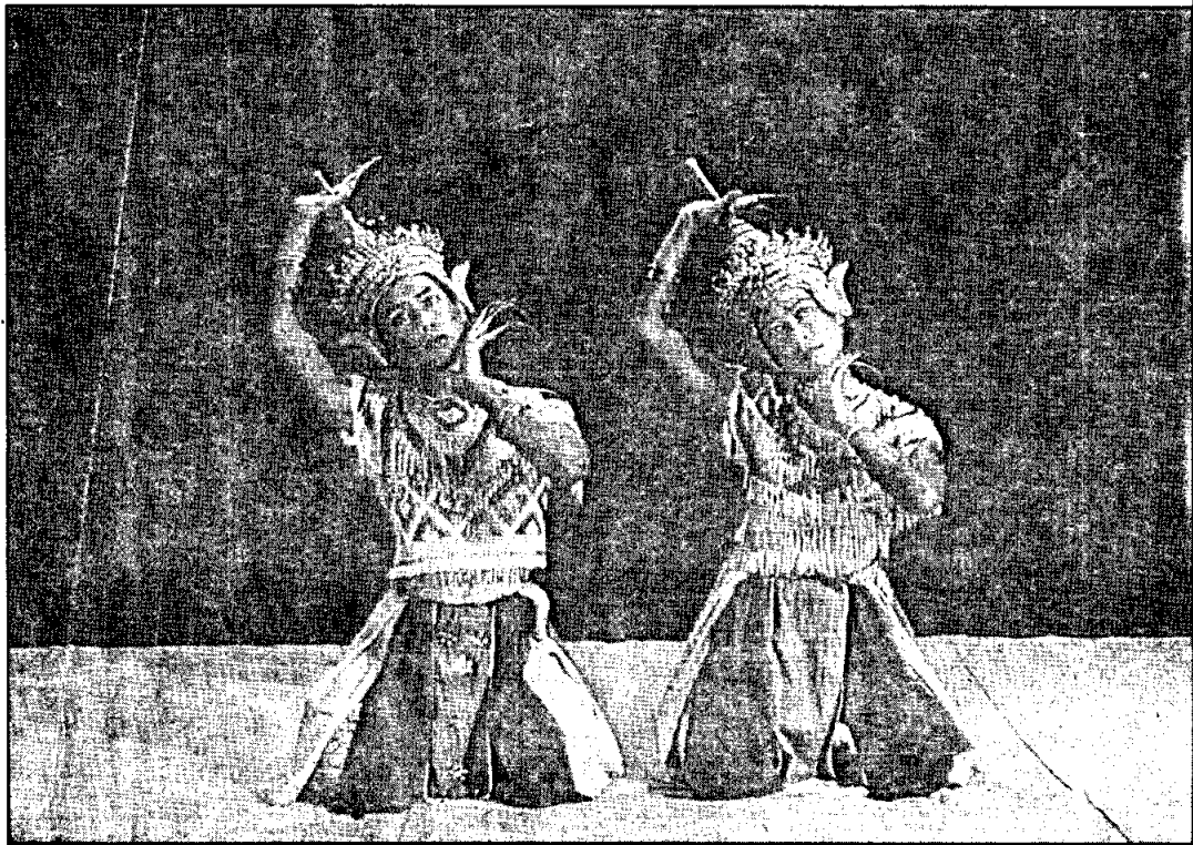
รูปการแสดงโนรา จากหนังสือ เข็ดชูเกียรติ พุ่มเทวา ชุนอุปถัมภ์นรากร