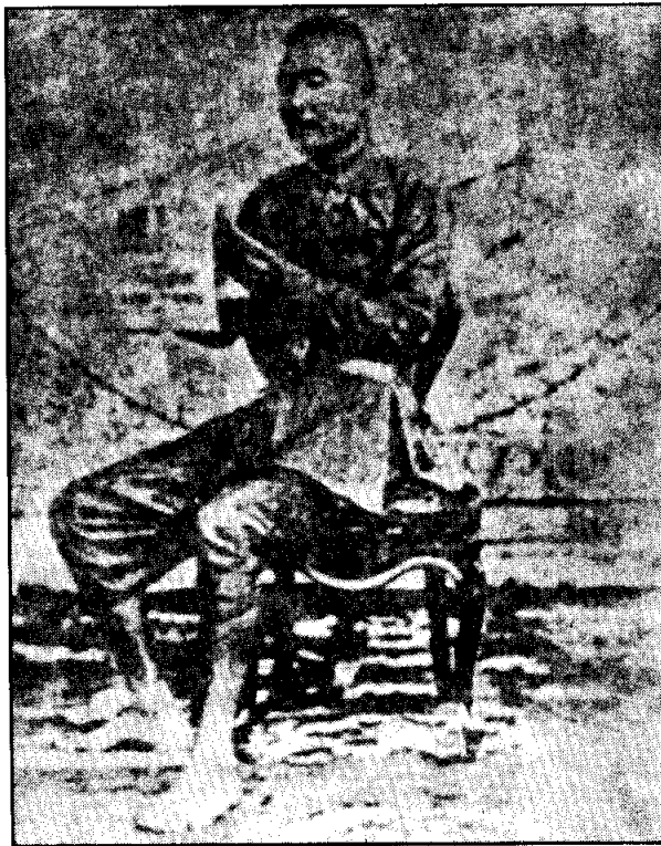
กรมขุนบดินทร์ไพศาลโสภณ ทรงดำกับโรงพิมพ์หลวง ในรัชกาลที่ ๕