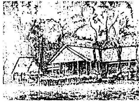
สมเด็จพระนางเจ้าเสาวภาผ่องศรีทรงเปิด ร.ร.เสาวภาเทวี และสั่งขังเพื่อยกระดับการศึกษาในหัวเมือง (พ.ศ. 2436)