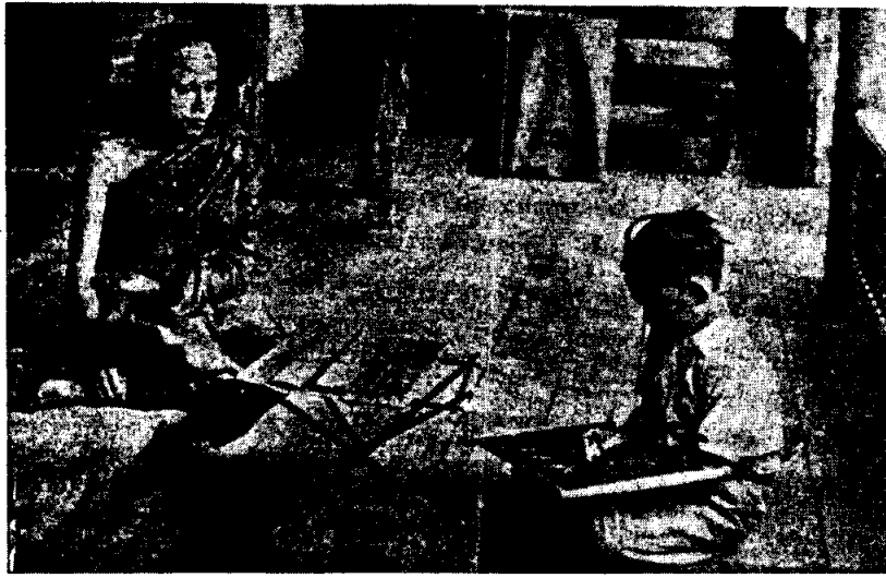
เด็กนักเรียนมูลกัจจายนะสมัยก่อน กำลังหัดเขียนลงบนกระดานชนวน กับครูซึ่งเป็นพระสงฆ์ ถ่ายเมื่อ พ.ศ. ๒๔๗๔