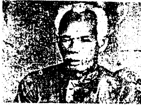
พระยาพรสุมทรโวหาร (น้อย อาจารยางกูร) (พ.ศ. 2365) ที่ละเซ่งเทรา อนังกรรม (16 ต.ค. 2434)