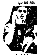
บ๊องไปใจ บ.เนโทหน้าใจใส