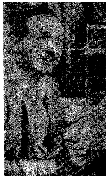
วอลท์ ดิสนี่

วอลท์ ดิสนี่ เจ้าของกิจการดิสนี่แลนด์ที่มีชื่อเสียงไปทั่วโลกเคยพลาดหวังจากตำแหน่งนักเขียนการ์ตูนประจำของหนังสือพิมพ์ จึงไปสมัครเป็นช่างเขียนแบบโฆษณา มีรายได้ 1,000 บาทต่อเดือน