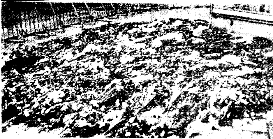
กุหลาบ ไว้อาลัย