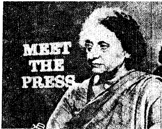
นางอินทิดา คานธี อดีตนายกรัฐมนตรี