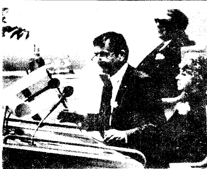
ปัญหาการลอบทำร้าย นายโธนาฟ พาดเม่ นายกรัฐมนตรี สวีเดน วัย 59 ปี ถูกลอบสังหาร กลางใจเมือง