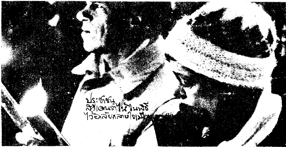
ประชาชนสวีเดนรำไห้ในพิธี ไว้อาลัยกลางใจเมือง