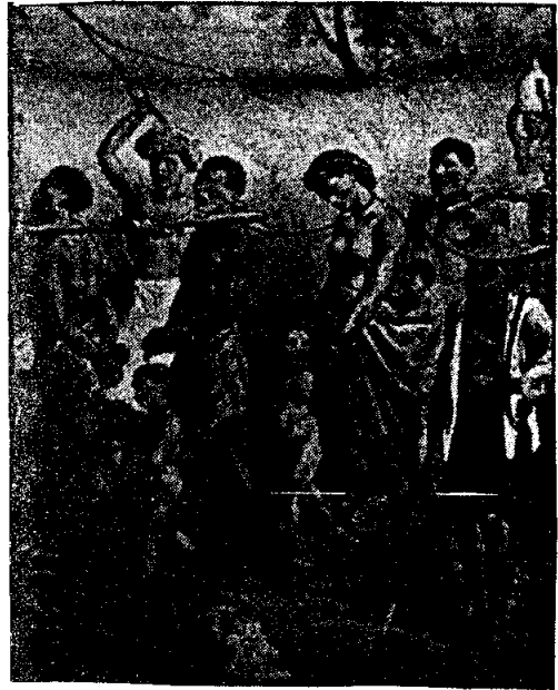
ทางสายทาส : ภาพแสดงการล่าชาวแอฟริกันเพื่อนำไปขายเป็นทาส

โดยเฉพาะเมื่อมีขบวนการค้นพบทองคำที่ละตินอเมริกา ยิ่งทำให้ตะวันตกต่างเห็นความจำเป็นในการซื้อทาสจากแอฟริกาเพิ่มมากขึ้นจนกล่าวได้ว่าทาสได้กลายมาเป็นสินค้าสำคัญของแอฟริกา 1 ซึ่งจะเห็นได้ว่า ทั้งโปรตุเกสและสเปนต่างซื้อทาสจากเซเนกัล แชมเบีย กินี เบนิน คองโก และโกลด์โคสต์ จำนวนกว่า 900,000 คน ไปยังละตินอเมริกาในศตวรรษที่ 16 ต่อมา ในศตวรรษที่ 17 ประเทศที่มีบทบาทสำคัญในการค้าทาส คือฮอลแลนด์เนื่องจากฮอลแลนด์ สามารถแทนที่อิทธิพลโปรตุเกสในแอฟริกาตะวันตกได้ และได้ทำการผูกขาดการค้าทาสในบริเวณนี้ อย่างไรก็ดีในปลายศตวรรษที่ 17 อังกฤษและฝรั่งเศสได้เข้ามามีบทบาทในการค้าทาสในแอฟริกาตะวันตก เพราะความต้องการทาสอย่างสูงใช้ในอาณานิคมในอเมริกาและสูงใช้ในอาณานิคมในอเมริกา และละตินอเมริกาจนทำให้การค้าทาสเจริญสูงสุดในศตวรรษที่ 18 อย่างไรก็ดี ในต้นศตวรรษที่ 19 การค้าทาสเริ่มลดน้อยลงเนื่องจากเริ่มมีการต่อต้านการค้าทาสโดยกลุ่มผู้เคร่งศาสนาอังกฤษหรือพวกเควกเกอร์ (Quakers) เนื่องจากเห็นว่าการค้าทาสเป็นเรื่องผิดทำนองคลองธรรม จนในที่สุดกลางศตวรรษที่ 19 การค้าทาสได้กลายเป็นการค้าที่ผิดกฎหมายซึ่งผู้ประกอบการต้องได้รับความผิด และการค้าทาสเริ่มลดน้อยลงตามลำดับ ภายหลังอเมริกาประกาศพระราชบัญญัติเลิกทาสในปี ค.ศ. 1865 ทำให้การค้าทาสในอเมริกาสิ้นสุด ทั้งนี้ นักวิจัยตะวันตกได้ประเมินว่าการค้าทาสให้กับชาวตะวันตกบริเวณชายฝั่งทะเลด้านตะวันตกของทวีปตลอดเวลา 4 ศตวรรษ (ตั้งแต่ศตวรรษที่ 15-19) มีการส่งทาสจำนวนประมาณ 9 ล้านคนไปยังทวีปอเมริกา ซึ่งในจำนวนนี้อาจมีบางส่วนเสียชีวิตด้วยโรคระบาด การ