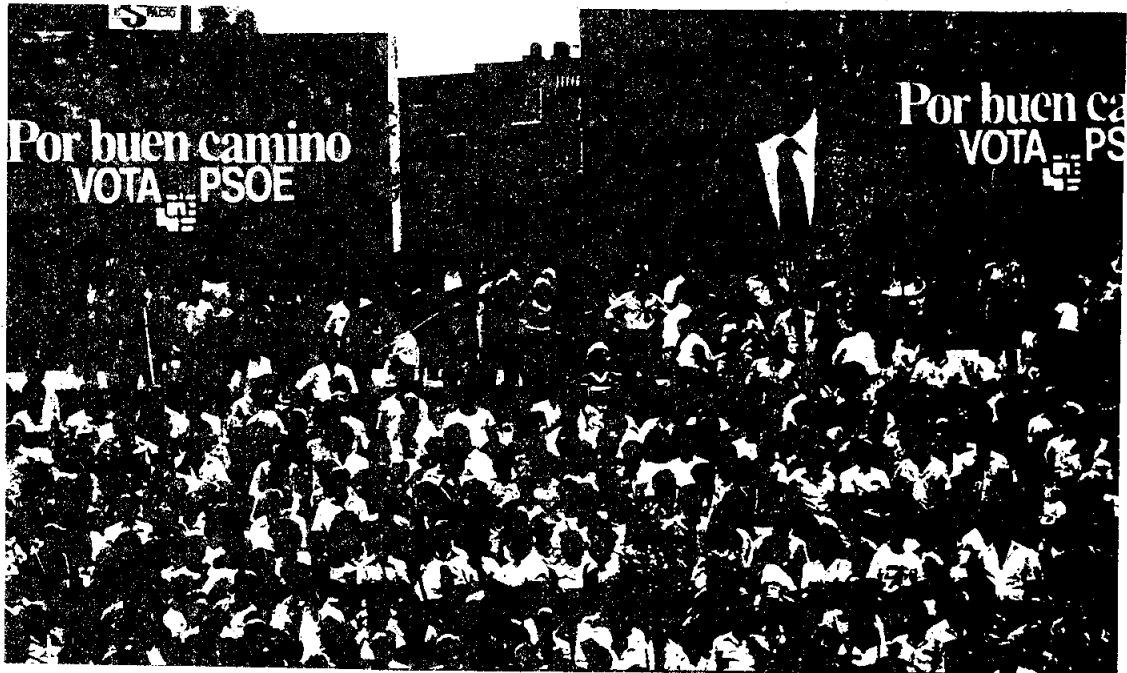
การรณรงค์หาเสียงเลือกตั้งในประเทศสเปน