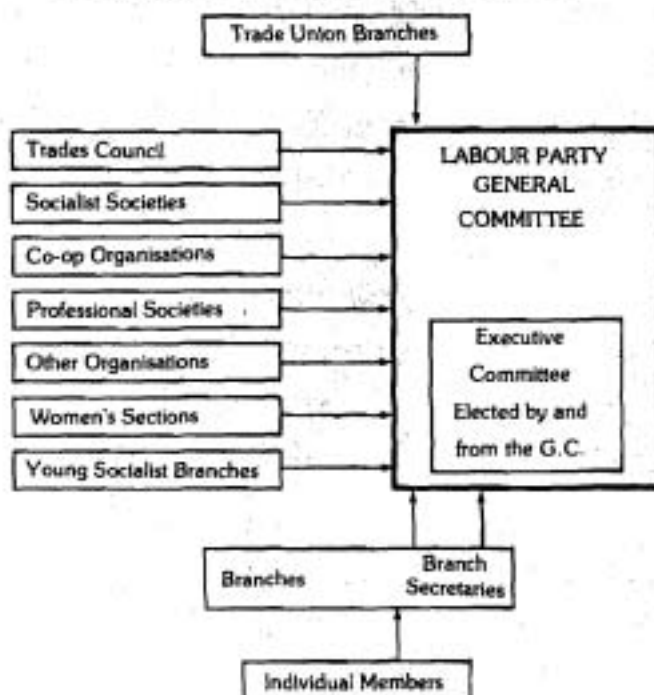
DIAGRAM ILLUSTRATING THE STRUCTURE OF A CONSTITUENCY LABOUR PARTY

ที่มา Harry B. Cole. The British Labour Party. A Functioning Parti Gipatory Democracy Pergamon Press. 1977. p. 61