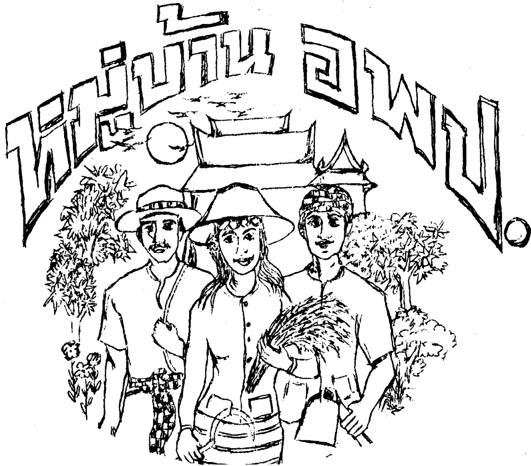
ตัวอย่าง จว.น่าน