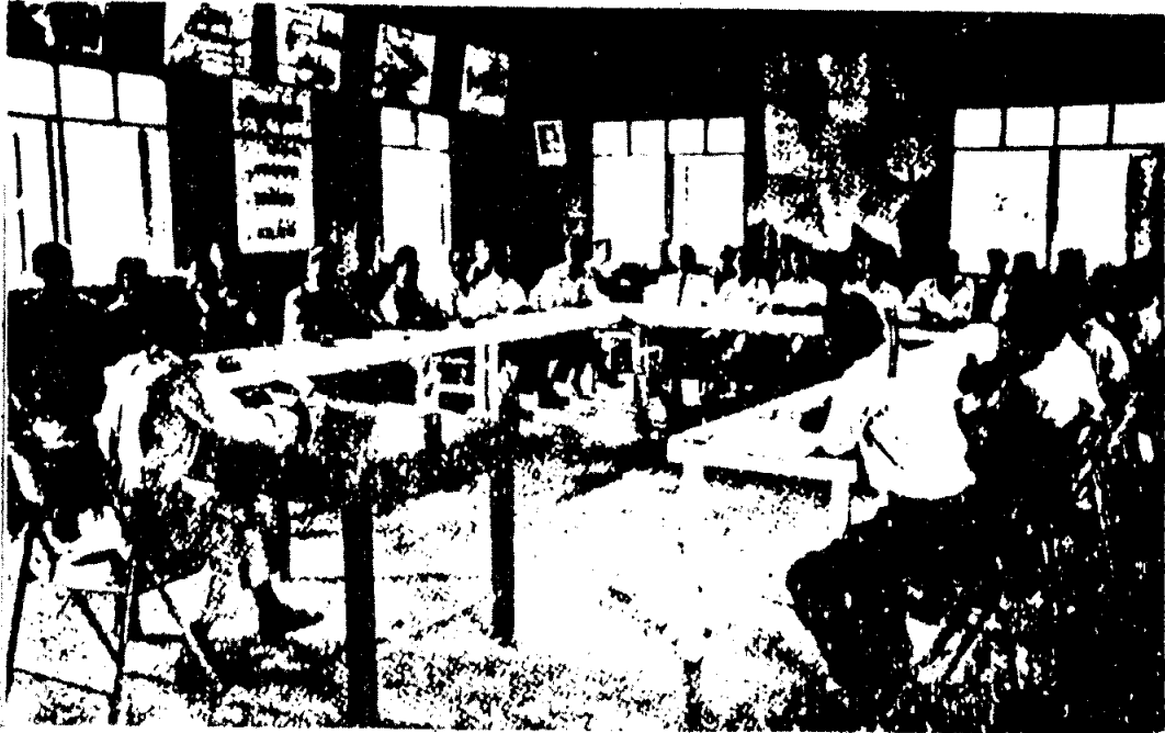
ประชุมกรรมการสภาตำบล วางแผนการพัฒนาอาชีพ ในเขตพัฒนาระดับตำบล, หมู่บ้าน Village and Tombon-level occupational development planning by the Tombon Council Committee.