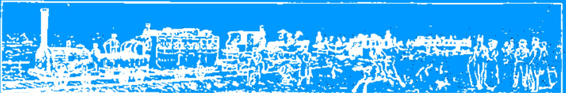
A FIRST CLASS TRAIN OF THE LIVERPOOL AND MANCHESTER RAIL, 1825