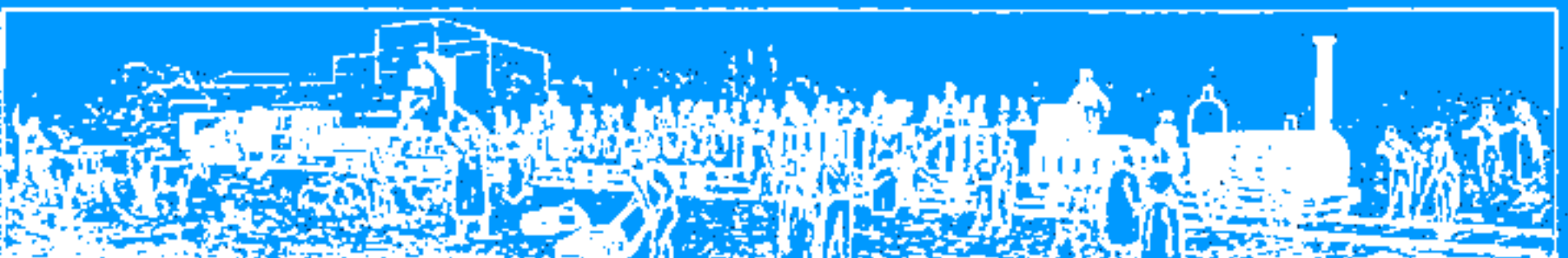
A SECOND CLASS TRAIN OF THE LIVERPOOL AND MANCHESTER RAIL, 1825