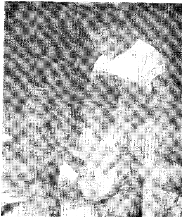
โรงเรียนหมู่บ้านเด็ก

9. ให้ตัวอย่างที่ดีแก่เด็ก โดยครูเป็นต้นแบบที่ดีให้แก่เด็ก