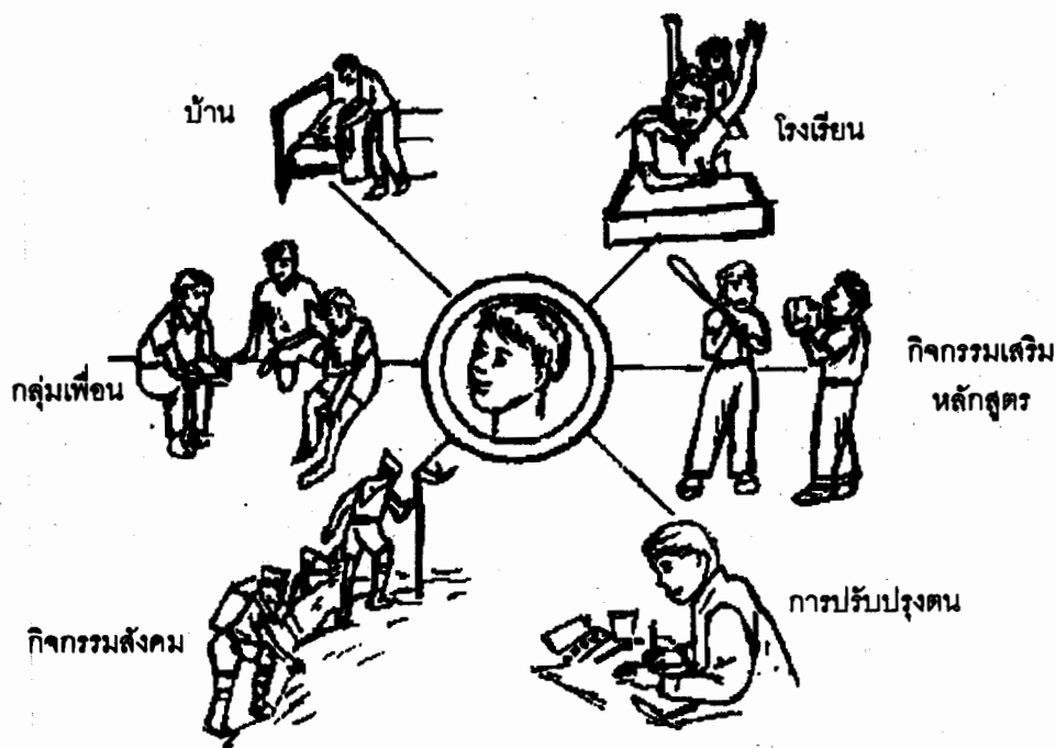
ภาพที่ 6.1 ความปรารถนาของเด็กในเรื่องการปรับตัว

วัยเด็กตอนปลายเป็นวัยที่เด็กเริ่มมีการปรับตัวให้เข้ากับสิ่งแวดล้อมทุกด้าน อันจะเป็นผลนำไปสู่ความสามารถในการประเมินความสามารถของตนเอง นอกจากนั้น จะเป็นเครื่องช่วยให้เกิดแรงผลักดันในการสร้างแรงจูงใจหรือระดับความทะเยอทะยานให้เกิดขึ้นมาใหม่ในตัวของเด็ก อันเป็นความปรารถนาของเด็กในการที่มีความต้องการให้มีการปรับตัวให้เข้ากับสิ่งแวดล้อมและลดแรงขับตนเองให้ได้ ดังภาพที่ 6.1 ในภาพจะเห็นได้ว่าเด็กมีความปรารถนาที่จะมีความสามารถในการพัฒนาในด้านครอบครัว ปรับตัวภายในกลุ่มเพื่อน ปรับตัวภายในโรงเรียน ปรับตัวในการเข้าร่วมกิจกรรมต่าง ๆ เป็นต้น