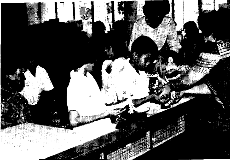
บุคลิกภาพจะเป็นแบบใด มีจุดเริ่มจากลักษณะการอบรมดูแลของพ่อแม่ตั้งแต่เยาว์วัย