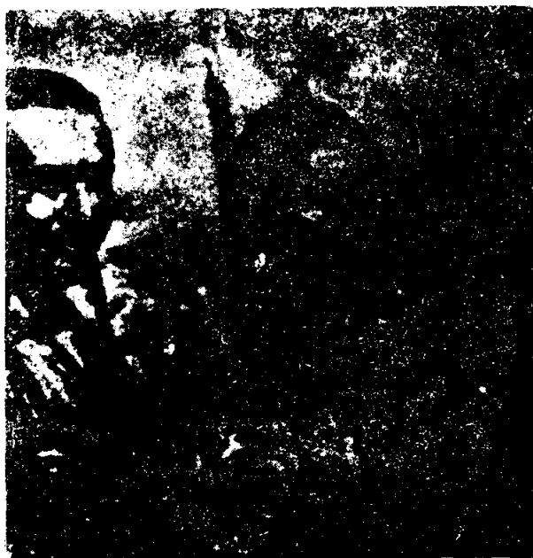
รัสเซลล์ (ซ้าย) หัวหน้าขบวนการอเมริกันอินเดียนแดง จับมือกับท่านสารุคุณเจมส์ สตรอง ซึ่งทางการอเมริกันส่งตัวเข้าไปเจรจาในหมู่บ้านวูนเดดนี

อินเดียนแดงเผ่าซุรวา 250 คน ที่เข้ายึด วูนเดดนี ได้เรียกร้องวุฒิสภาสหรัฐทำการสอบสวนวิธีการที่สหรัฐอเมริกาปฏิบัติต่อพวกเขาเสียใหม่ เพื่อให้เกิดความยุติธรรมมากขึ้น