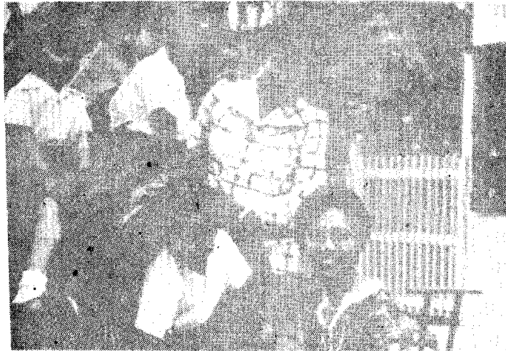
“รูปแสดงถึงการเล่นที่แตกต่างกันของเด็ก”