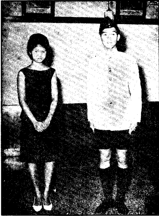
ภาพที่ 2 ยืนเฉพาะหน้าผู้ใหญ่ -ตรง