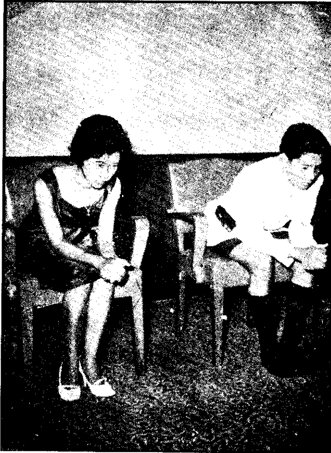
ภาพที่ 6 นั่งลงศอก

4. การนั่งในขณะที่สนทนากับผู้ทรงอาวุโสสูง ควรนั่งลงศอก คือนั่งพับเพียบวางศอกลงบนเข่าข้างเดียวหรือสองข้าง และประสานมือเข้าด้วยกัน ในขณะที่นั่งเก้าอี้ ควรนั่งลงศอกด้วย (ภาพที่ 6)