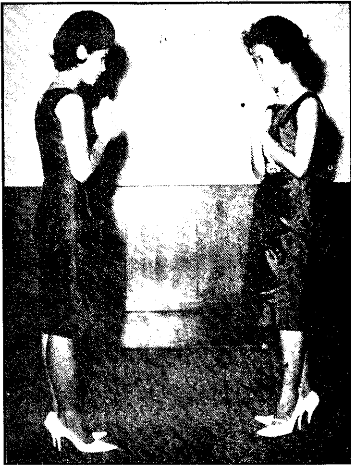
ภาพที่ 8 ไหว้ผู้มีฐานะเสมอกัน

1.1 เสมอก สำหรับผู้มีฐานะเสมอกัน หรือรับไหว้ผู้น้อยไม่ต้องน้อมศีรษะ หรือ ก้มศีรษะเล็กน้อย (ภาพที่ 8)