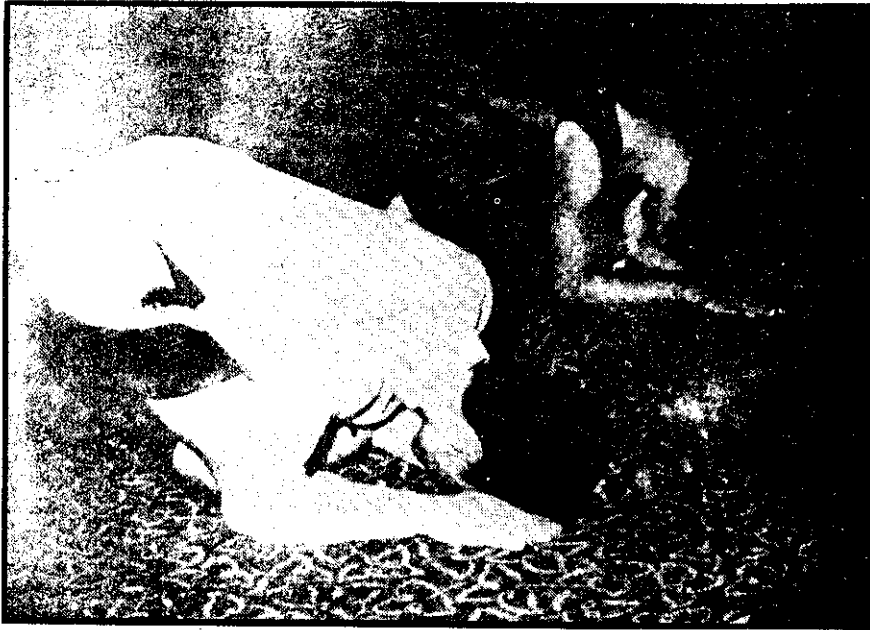
ภาพที่ 10 กราบแบบเบญจางคประดิษฐ์

5. การกราบแบบเบญจางคประดิษฐ์ เป็นวิธีเคารพพระภิกษุ พระพุทธรูปหรือพระรัตนตรัย วิธีกราบที่ถูกต้องคือจะต้องให้ส่วนของร่างกาย 5 ส่วนจรดพื้น คือหน้าผาก มือ 2 มือ เข่า 2 เข่า (ภาพที่ 10)