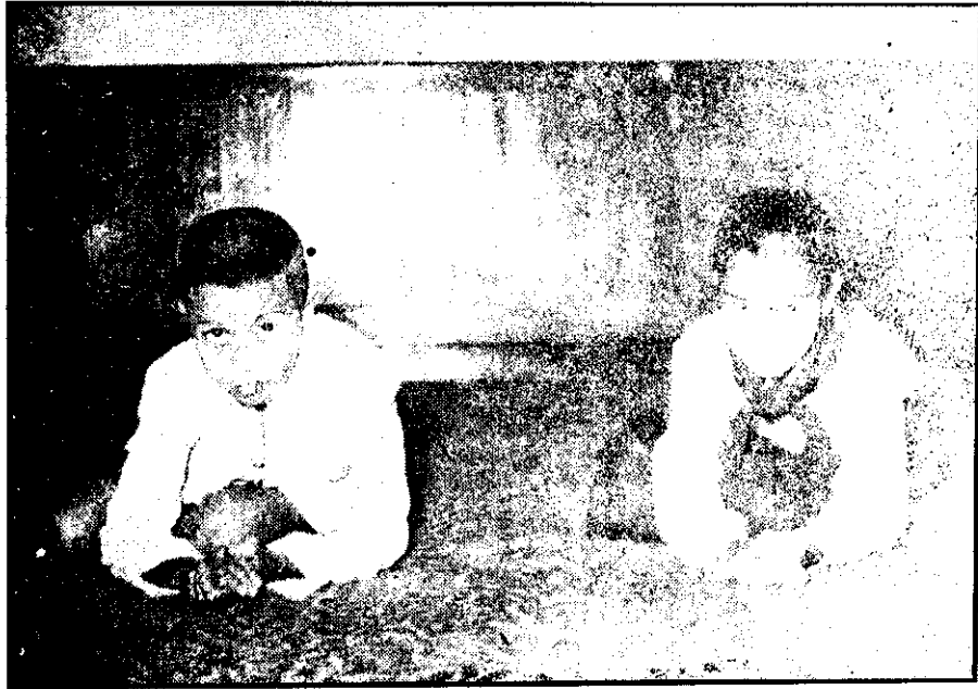
ภาพที่ 7 หมอบ

5. ในการนั่งกับพื้น เมื่อมีโอกาสสนทนากับผู้ทรงอาวุโสซึ่งนั่งกับพื้นเช่นเดียวกัน ควรใช้วิธีหมอบประสานมือ (ภาพที่ 7) เมื่อเสร็จการสนทนาควรกราบลงและคลานออกมา