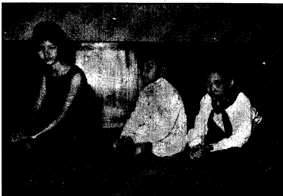
ภาพที่ 5 นั่งต่อหน้าผู้ใหญ่

3. การนั่งกับพื้นเฉพาะหน้าผู้ใหญ่ ควรนั่งพับเพียบโดยส้ารวมตัว ต้องเก็บปลายเท้า วางสะโพกให้แน่น วางมือไว้บนตัก และน้อมตัวเล็กน้อย (ภาพที่ 5)