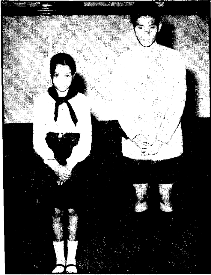
ภาพที่ 3 ยืนเฉพาะหน้าผู้ใหญ่-ค้อมส่วนบน