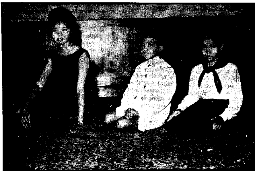
ภาพที่ 4 นั่งตามลำพัง

3. การนั่งกับพื้นเฉพาะหน้าผู้ใหญ่ ควรนั่งพับเพียบโดยส้ารวมตัว ต้องเก็บปลายเท้า วางสะโพกให้แน่น วางมือไว้บนตัก และน้อมตัวเล็กน้อย (ภาพที่ 5)