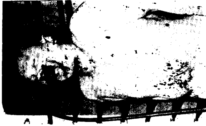
รูปที่ 20.1 หน้าตัวตายโดยคิมโซคาไฟ (มีรอยไหม้รอบริมฝีปาก) ร่วมกับการเชือดคอ