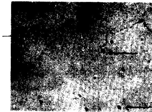
รูปที่ 12.4 ตัวอสุจิ (ตรงลูกศรชี้) พบจากช่องคลอดของหญิงที่ถูกข่มขืนกระทำชำเรา ขยาย 400 เท่า