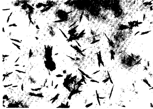
รูปที่ 12.5 รูปร่างของผลึกที่ให้ผลบวกในการทดสอบฟลอเรนซ์

คราบน้ำมันน่าจะเป็นน้ำอสุจิ การตรวจสอบสารเคมีนี้ไม่อาจยืนยันได้แน่นอนเหมือนกรณีที่ตรวจพบตัวอสุจิ เพราะสารเคมีดังกล่าวมิได้มีอยู่เฉพาะแต่ในน้ำอสุจิเท่านั้น