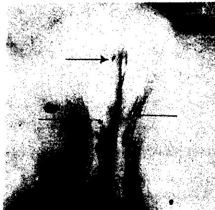
รูปที่ 12.2 รอยฟกช้ำ (ตรงจุดศร) พบที่อวัยวะสืบพันธุ์ภายนอกของเด็กหญิง ที่ถูกข่มขืนกระทำชำเรา แล้วถูกฆ่าตาย