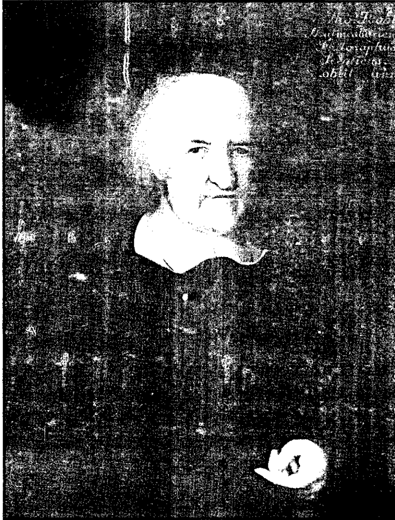
HOBBS, Thomass (1588-1679), portrait by an unknown artist.