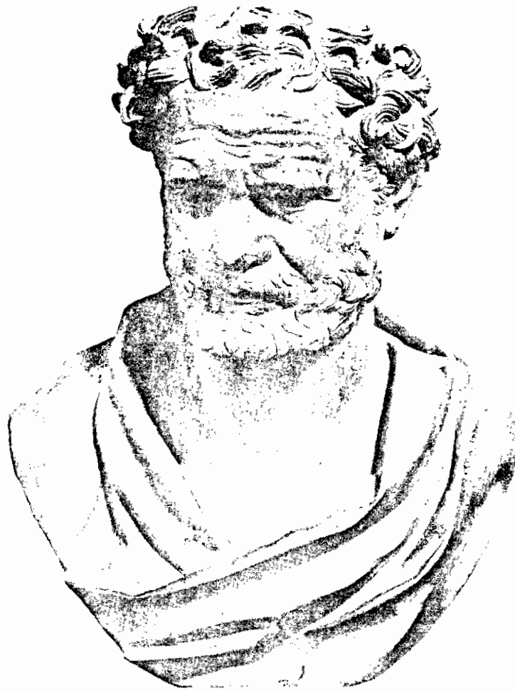
DEMOCRITUS (fifth century B.C.), bronze bust found at the villa Papiri at Herculaneum. The bust is a Roman copy of a Greek original. (National Museum, Naples)