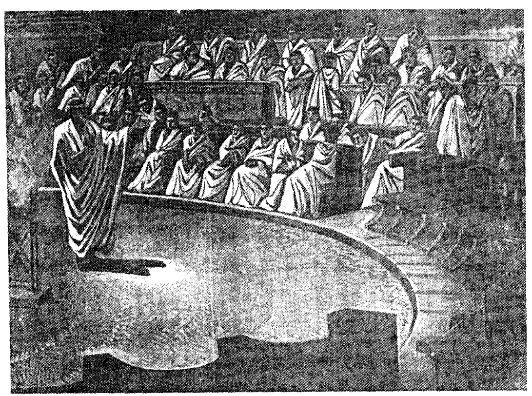
The Senate was the most ancient and respected organ of the government in Rome. Caesar filled it with his supporters, but it was in the Senate that he was assassinated in 44 B.C.