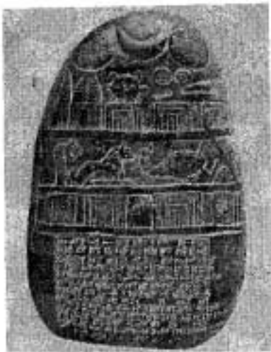
Cuneiform inscriptions, written on clay, were baked or dried to permanent hardness. This document, reporting a gift of land, is 3000 years old.

จนกระทั่งเมื่อ 3,000 ปีก่อนคริสต์ศักราช พวกชาวซูเมเรียน (Sumerians) เป็นชนเผ่าแรกที่เข้ามาตั้งถิ่นฐานบ้านเรือนโดยจัดตั้งเป็นนครรัฐขึ้น พวกซูเมเรียนได้คิดวิธีเขียนหนังสือโดยใช้ไม้ไผ่หรือปลายธัญพืชทำเป็นรูปกลมกลิ้งไปบนแผ่นดินเหนียวที่ยังอ่อน ทำให้เกิดเป็นรอยรูปกลม เมื่อเขียนเสร็จก็นำไปเผาไฟหรือฝังแดดให้แข็ง ตัวหนังสือแบบนี้จึงรู้จักกันในนามว่า อักษรรูปกลม (Cuneiform) หรือเรียกกันว่าอักษรรูปสี่เหลี่ยม เพราะมาจากภาษาละติน คือ Cuneus แปลว่าอินันเอง