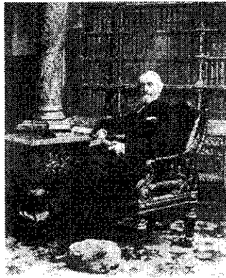
เอนธเวอร์ธ แรนด์ สโปฟฟอร์ด (Ainsworth Rand Spofford) หัวหน้าบรรณารักษ์ห้องสมุดรัฐสภาอเมริกันระหว่างปี ค.ศ. 1864 – 1897 เป็นผู้ขยายสัญลักษณ์ประจำหนังสือให้มีความละเอียดยิ่งขึ้น

เมื่อห้องสมุดรัฐสภามีสิ่งพิมพ์เพิ่มมากขึ้น การจัดหมวดหมู่และการให้สัญลักษณ์ประจำหนังสือมีปัญหาตามมา บุคคลที่มีบทบาทสำคัญ คือ เอนธเวอร์ธ แรนด์ สโปฟฟอร์ด (Ainsworth Rand Spofford) บรรณารักษ์ห้องสมุดรัฐสภาอเมริกันในระหว่างปี ค.ศ. 1864 – 1897 ได้ขยาย