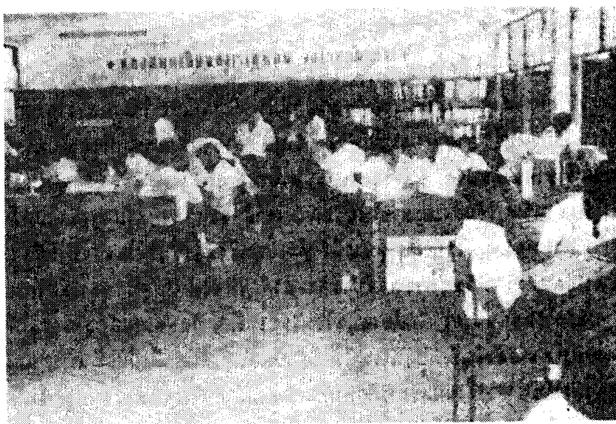
ห้องสมุดโรงเรียนเทพศิลา กรุงเทพมหานคร