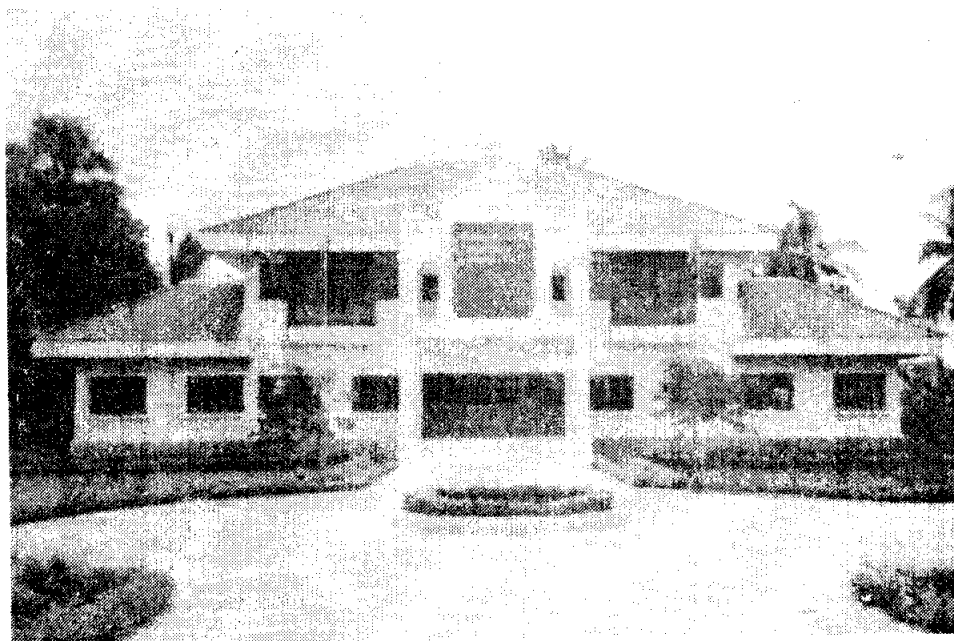
ห้องสมุดประชาชน "เฉลิมราชกุมารี" อ.ทับคล้อ จังหวัดพิจิตร

1.3.1 ห้องสมุดประชาชน หมายถึงห้องสมุดที่สร้างขึ้นเพื่อให้บริการแก่ประชาชน โดยไม่จำกัดเพศ วัย เชื้อชาติ ศาสนา และพื้นฐานความรู้ ห้องสมุดประชาชนให้บริการสารสนเทศครบทุกหมวดวิชา อาจมีบริการบางเรื่องเป็นพิเศษตามความต้องการของท้องถิ่น ห้องสมุดประชาชนจะให้บริการแก่ประชาชนโดยไม่คิดมูลค่า มีอยู่ทั่วไปในชุมชนโดยเฉพาะในเขตอำเภอและจังหวัด