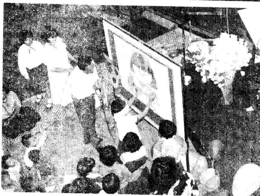
กิจกรรมในห้องสมุดสำหรับเด็ก