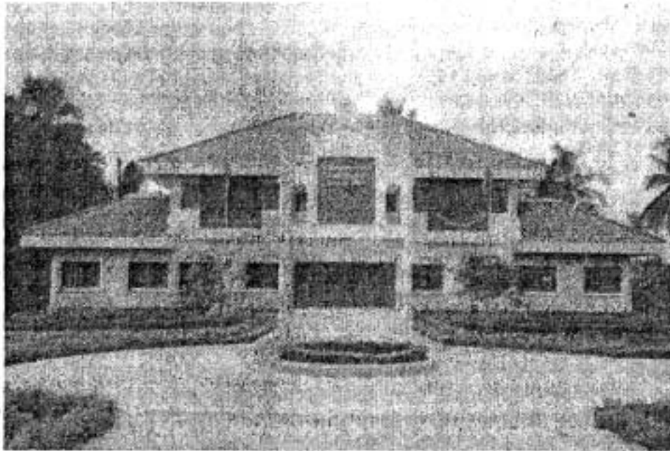
ห้องสมุดประชาชน "เฉลิมราชกุมารี" อ.ทับคล้อ จังหวัดพิจิตร

1.3.1 ห้องสมุดประชาชน หมายถึงห้องสมุดที่สร้างขึ้นเพื่อให้บริการแก่ประชาชน โดยไม่จำกัดเพศ วัย เชื้อชาติ ศาสนา และพื้นฐานความรู้ ห้องสมุดประชาชนให้บริการสารสนเทศครบทุกหมวดวิชา อาจมีบริการบางเรื่องเป็นพิเศษตามความต้องการของท้องถิ่น ห้องสมุดประชาชนจะให้บริการแก่ประชาชนโดยไม่คิดมูลค่า มีอยู่ทั่วไปในชุมชนโดยเฉพาะในเขตอำเภอและจังหวัด