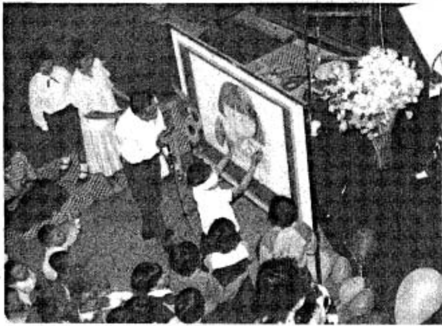
กิจกรรมในห้องสมุดสำหรับเด็ก