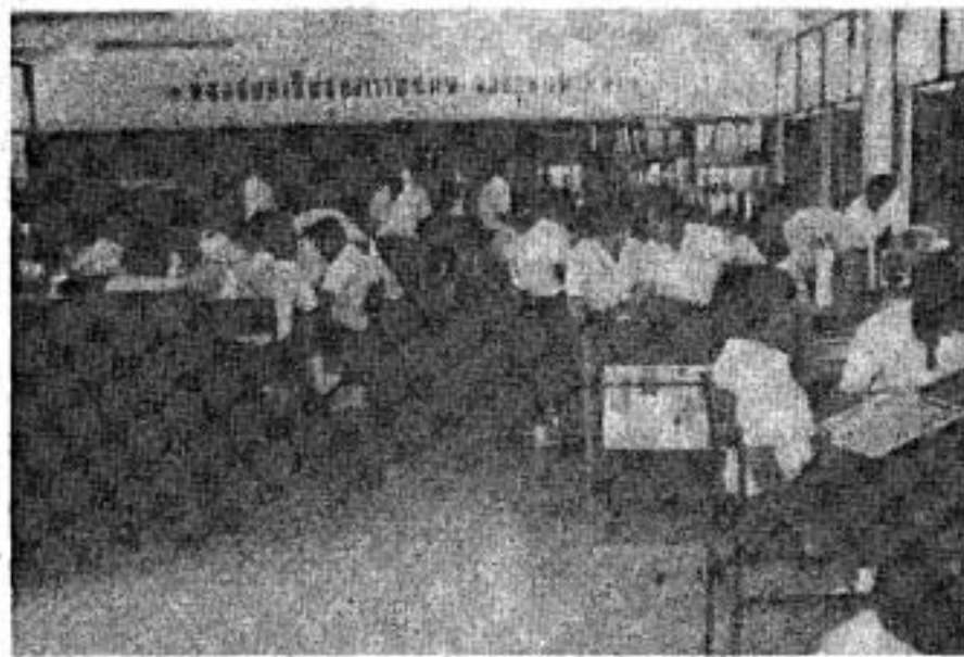
ห้องสมุดโรงเรียนเทพศิรินทร์ กรุงเทพมหานคร