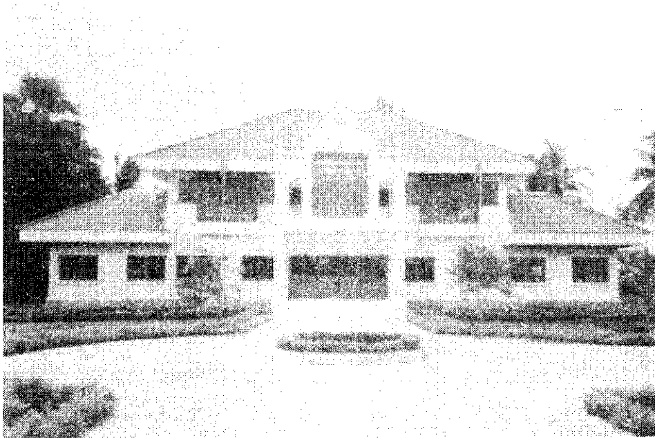
ห้องสมุดประชาชน “เฉลิมราชกุมารี” อ.ทับคล้อ จังหวัดพิจิตร

1.3.1 ห้องสมุดประชาชน หมายถึงห้องสมุดที่สร้างขึ้นเพื่อให้บริการแก่ประชาชน โดยไม่จำกัดเพศ วัย เชื้อชาติ ศาสนา และพื้นฐานความรู้ ห้องสมุดประชาชนให้บริการสารสนเทศครบทุกหมวดวิชา อาจมีบริการบางเรื่องเป็นพิเศษตามความต้องการของท้องถิ่น ห้องสมุดประชาชนจะให้บริการแก่ประชาชนโดยไม่คิดมูลค่า มีอยู่ทั่วไปในชุมชนโดยเฉพาะในเขตอำเภอและจังหวัด