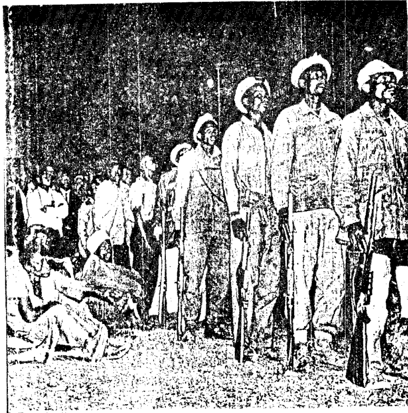
รูปที่ 20 : ทหารคิซุถึงป้อมแบบเก่าขณะเกิดกบฏเมามา