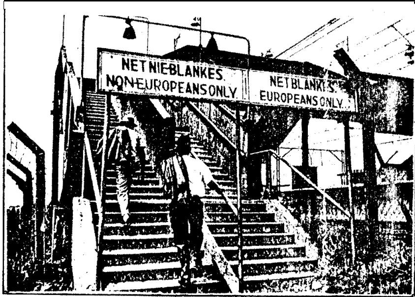
รูปที่ 18 ภาพทางเดินแบ่งแยกระหว่างคนผิวดำและคนผิวขาวในแอฟริกาใต้ Ibid., P.250.