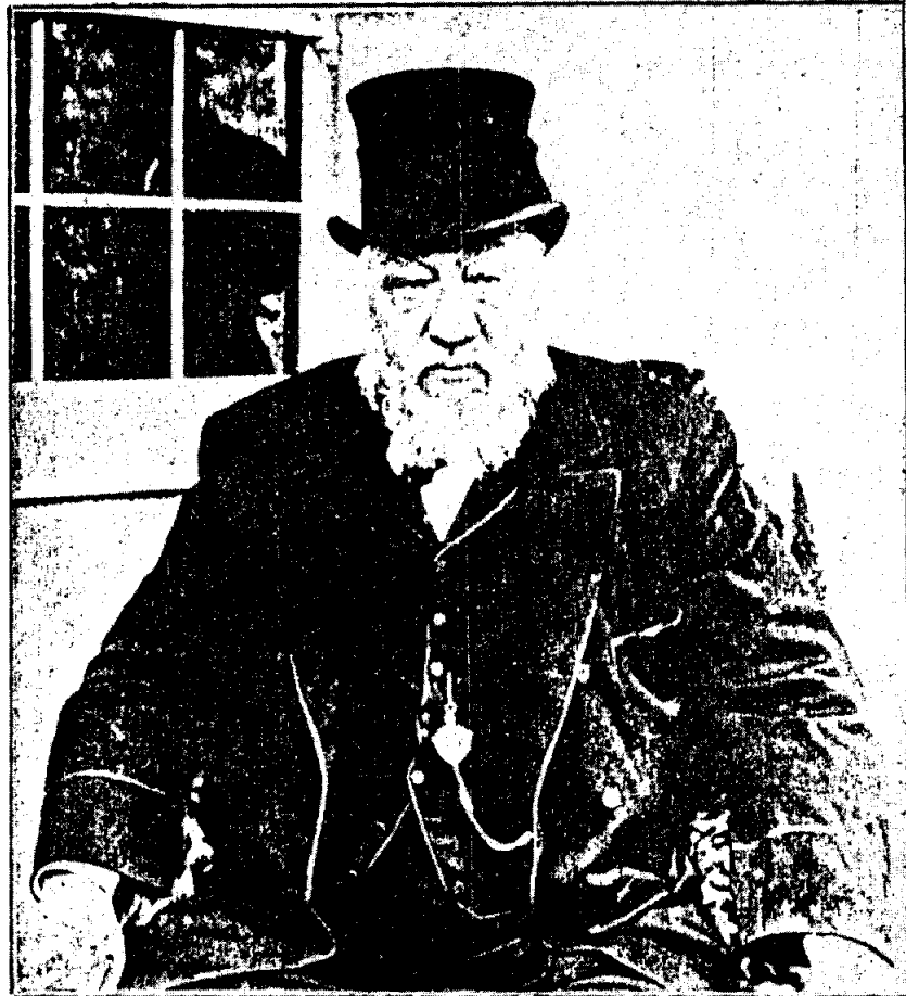
รูปที่ 17: ประธานาธิบดีครุเกอร์แห่งทรานสวาล Ibid., P. 205.