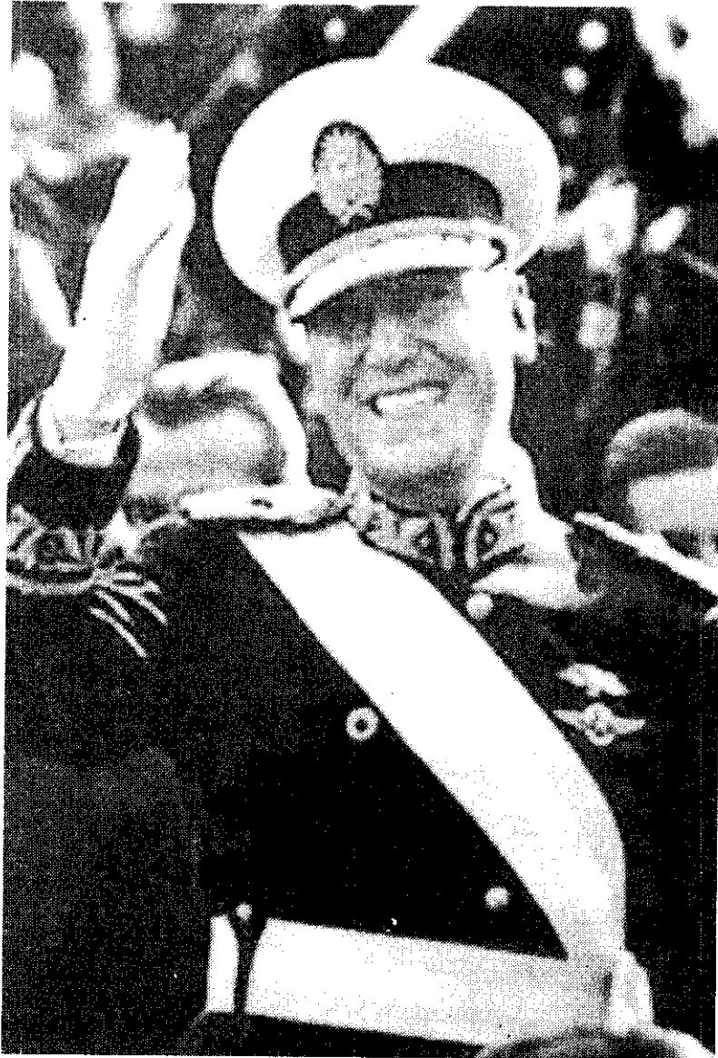
ฮวน ดี เปรอน (ค.ศ. 1946-1955, 1973-1974)