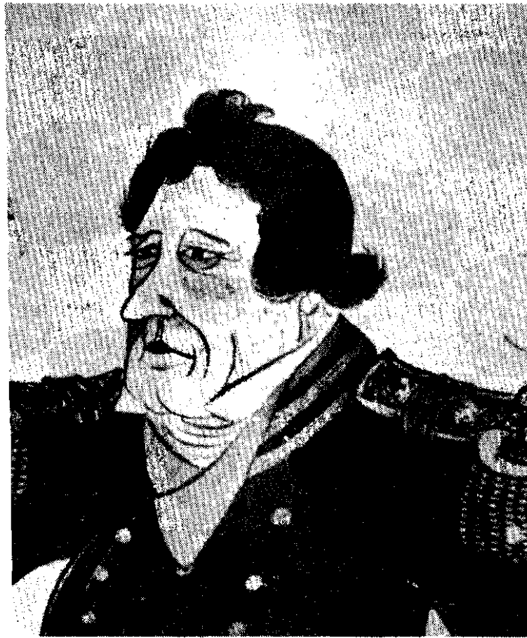
ภาพวาด พลจัตวาแมทธิว เพอร์รี่ (ชาวญี่ปุ่นवाद)