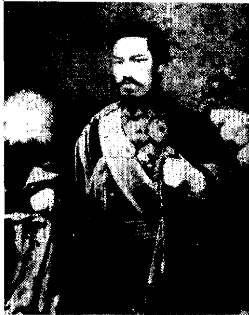
จักรพรรดิเมอิจิ