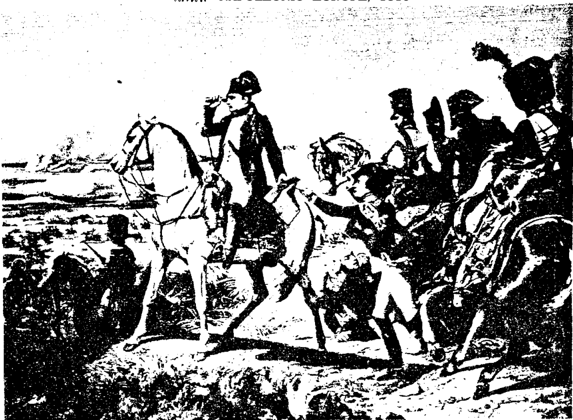
พระเจ้านโปเลียนในสงครามที่ Wagram