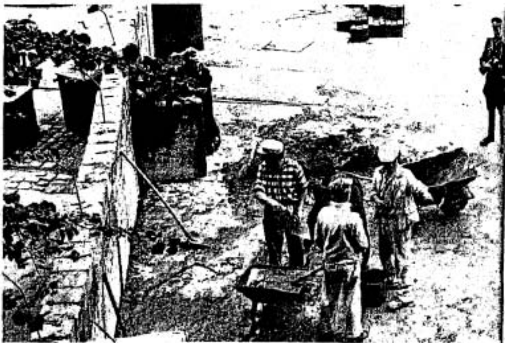
▲ การสร้างกำแพงกรุงเบอร์ลิน เมื่อวันที่ 13 สิงหาคม ค.ศ. 1961