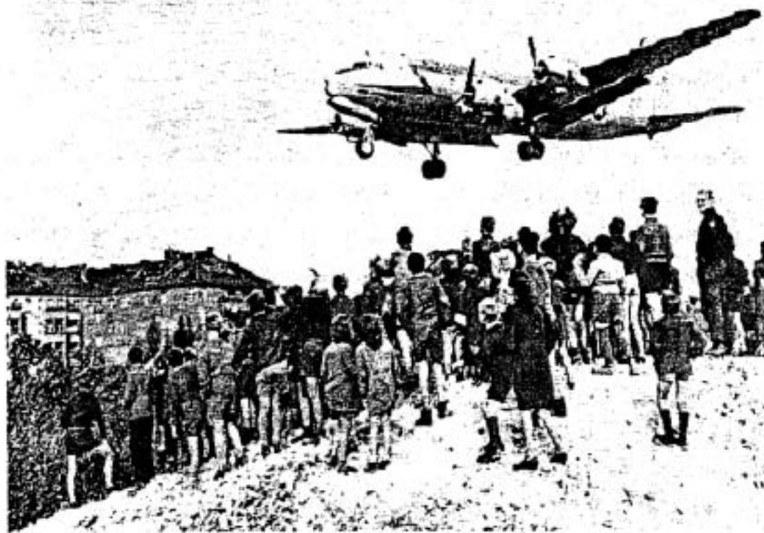
▲ การปิดล้อมกรุงเบอร์ลิน เครื่องบินขนส่งอเมริกามาถึงพร้อมกับสิ่งของเครื่องใช้สำหรับชาวเบอร์ลิน ตะวันตก

ปฏิบัติการปิดกั้นกรุงเบอร์ลินเริ่มขึ้นเมื่อวันที่ 30 มีนาคม ค.ศ. 1948 สหภาพโซเวียตสกัดการคมนาคมทั้งทางรถไฟเชื่อมติดต่อกันระหว่างกรุงเบอร์ลินกับเยอรมนีตะวันตก แม้ว่ากรุงเบอร์ลินจะอยู่ในเขตยึดครองของสหภาพโซเวียตหรือในเขตเยอรมนีตะวันออก แต่เฉพาะกรุงเบอร์ลินนั้นแบ่งเขตยึดครองออกเป็น 4 เขต ภายใต้การดูแลของคณะปกครอง