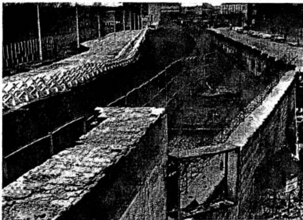
▲ บางส่วนของกำแพงเบอร์ลิน