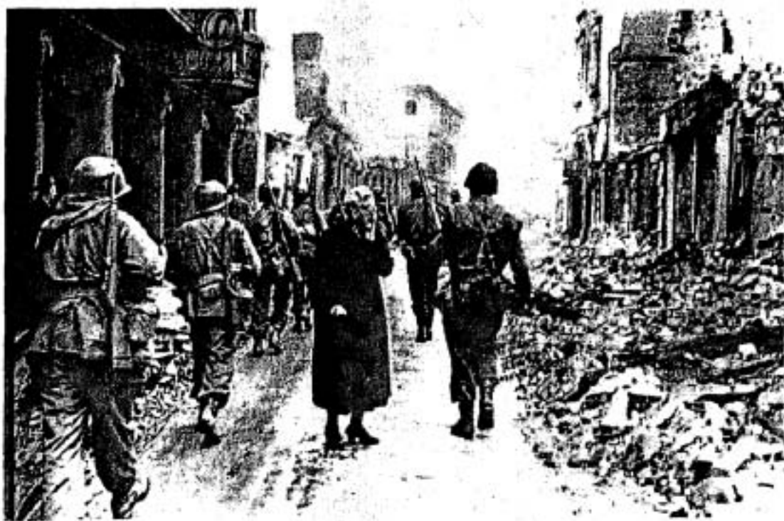
▲ การปิดครองไรน์แลนส์โดยกองทัพอเมริกันในเดือนมีนาคม ค.ศ. 1945