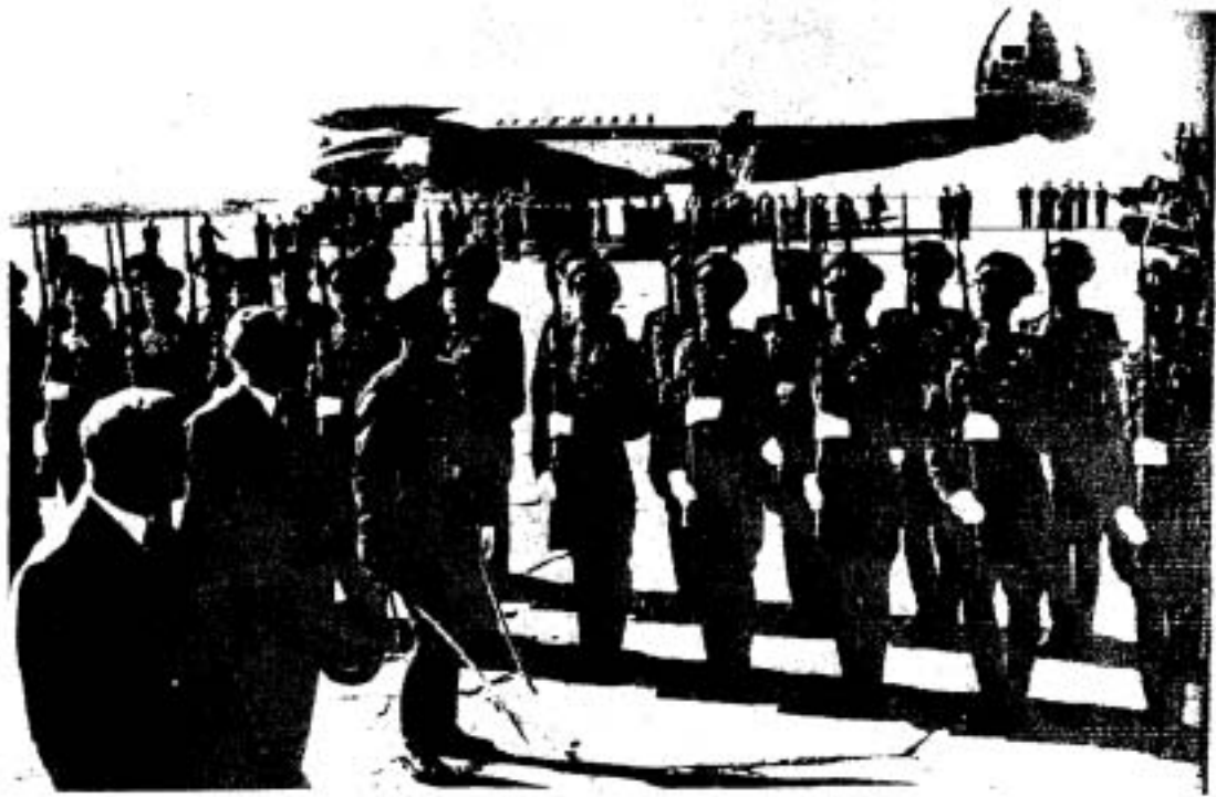
▲ นายกรัฐมนตรีคอนราต อาเดเนา (Konrad Adenauer) ได้รับการต้อนรับอย่างเป็นทางการที่สนามบินกรุงมอสโก เมื่อวันที่ 8 กันยายน ค.ศ. 1955

ในเดือนตุลาคม ค.ศ. 1957 สหภาพโซเวียตสามารถสร้างขีปนาวุธยิงข้ามทวีปได้ รวมทั้งการส่งดาวเทียมสปุตนิก 1 (Sputnik I) ขึ้นโคจรในอวกาศ ความสำเร็จของสหภาพโซเวียตยิ่งทำให้ประเทศฝ่ายโลกเสรีวิตกกังวลขึ้น ในเวลาเดียวกันก็ทำให้สหภาพโซเวียตเชื่อมั่นว่าการเป็นผู้นำด้านนิวเคลียร์จะทำให้ฝ่ายตนดำเนินนโยบายรุกได้มากขึ้น ดังนั้นในเดือนพฤศจิกายน ค.ศ. 1958 ครุซชอฟจึงประกาศว่าเขาไม่รับรู้สิทธิของมหาอำนาจตะวันตกในเบอร์ลินตะวันตก ทั้งยื่นคำขาดให้มหาอำนาจตะวันตกถอนกองกำลังออกจากเบอร์ลินตะวันตก ภายในเวลา 6 เดือน ทั้งให้ยอมรับการที่สาธารณรัฐประชาธิปไตยเยอรมัน (เยอรมนีตะวันออก) จะเข้าครอบครองเบอร์ลินทั้งหมด ความเคลื่อนไหวครั้งนี้เป็นเพราะฝ่ายสหภาพโซเวียตรู้สึกเสียหน้า เนื่องจากสภาพการดำรงชีวิตรหว่างเบอร์ลินตะวันตกและเบอร์ลินตะวันออกมีความแตกต่างกันมากและเป็นเหตุให้เกิดการนัดหยุดงานและการก่อความไม่สงบต่างๆ ในเบอร์ลินตะวันออก นับตั้งแต่ ค.ศ. 1945 ชาวเยอรมันตะวันออกมากกว่า 3 ล้านคนได้พากันหลบหนีมายังเบอร์ลินตะวันตก ซึ่งมีผลเสียหายอย่างร้ายแรงต่อเศรษฐกิจของเยอรมนีตะวันออก ชื่อเรียกร่องของครุซชอฟที่ให้กองกำลังของมหาอำนาจ