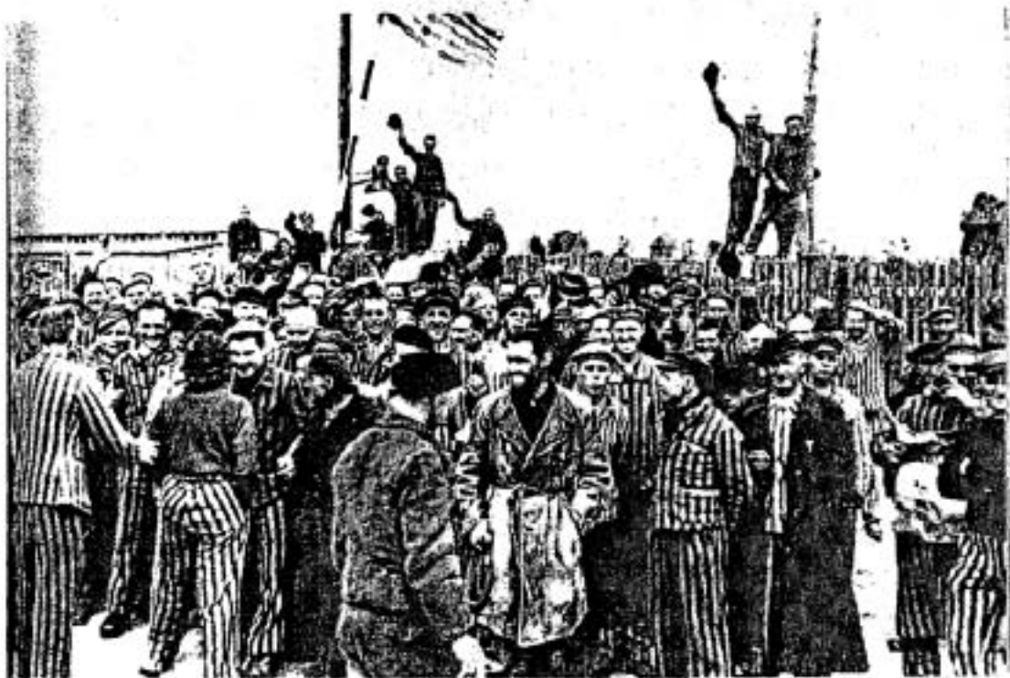
▲ การปลดปล่อยนักโทษค่ายกักกันที่ดาเคา (Dachau) เมื่อวันที่ 29 เมษายน ค.ศ. 1945