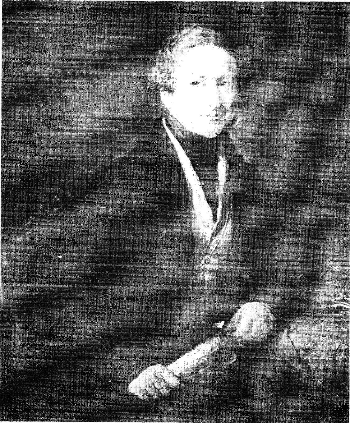
Sir Robert Peel, by John Linnell.