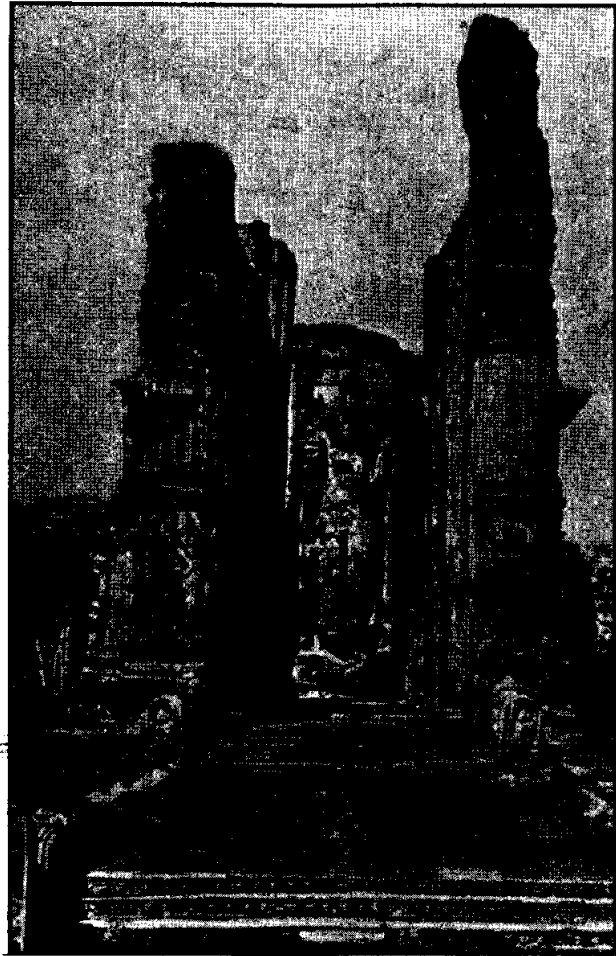
วิหารสังกาศิลก เมืองโบลอนนาระ

มีการสร้างเขื่อน ๑๖๕ แห่ง ชุกคลอง ๓,๙๑๐ คลอง สร้างอ่างเก็บน้ำขนาดเล็ก ๒,๓๗๖ แห่ง อ่างเก็บน้ำที่ใหญ่ที่สุดกินเนื้อที่ถึง ๕,๙๔๐ เอเคอร์