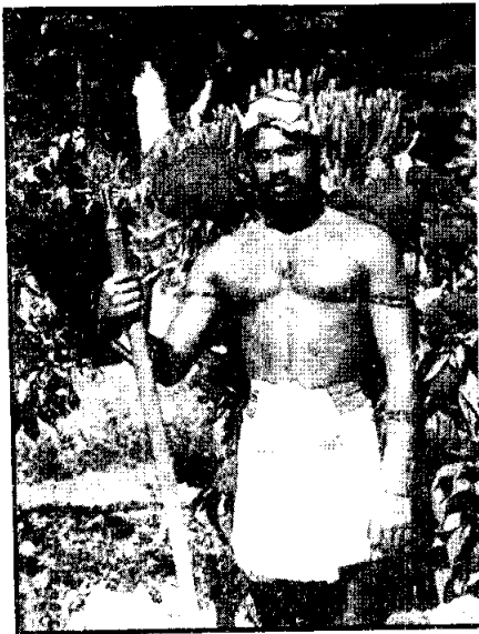
ชาวพื้นเมืองสิงหล

การสันนิษฐานโดยหลักฐานทางโบราณคดีจึงสรุปว่า ประวัติศาสตร์อารยธรรมของศรีลังกา น่าจะเริ่มขึ้นเมื่อประมาณห้าพันปีมาแล้ว ชาวพื้นเมืองยุคแรกอาจจะมีอยู่หลายเผ่าพันธุ์ อาจจะมีทั้งพวกสิงหล (Sinhalese) พวกทมิฬ (Tamil) พวกมัวร์ (Moors) พวกมาเลย์รุ่นแรก (Proto-Malay) นอกเหนือจากพวกเวททะดังกล่าวแล้ว