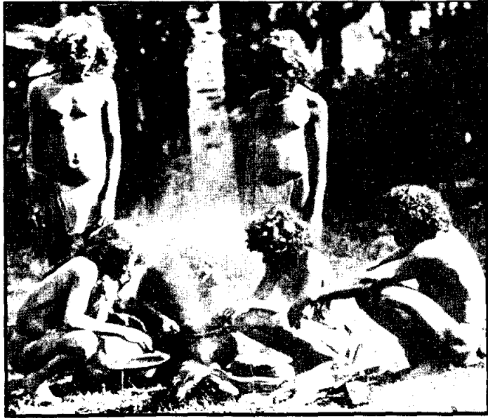
ชนเผ่าเวทะเมื่อคริสต์ศตวรรษที่ 19

ก่อนจะเข้าสู่สมัยประวัติศาสตร์ของศรียุคอันแท้จริง ฟิงทรามภูมิล้างของดินแดนแห่งนี้ก่อนว่า จากหลักฐานการค้นพบของนักโบราณคดีทำให้ได้พบเค้าเงื่อนเกี่ยวกับชุมชนบนเกาะลังกาสยามก่อนประวัติศาสตร์ว่า มีมนุษย์เผ่าหนึ่งลักษณะสันคิ้วหนา สันนิษฐานกันว่าน่าจะเป็นชนเผ่าแรกบนเกาะลังกา กระจุกสันคิ้วนั้นพบปะปนอยู่กับกระจุกชิปโปโปเตมัส และเครื่องมือ เครื่องใช้ที่ทำด้วยหินอย่างหยาบ ๆ ในบ่อพลอย ที่เมืองรัตนปุระ นักโบราณคดีพิสูจน์ว่าเป็นร่องรอยสมัยหินระหว่างยุคน้ำแข็ง