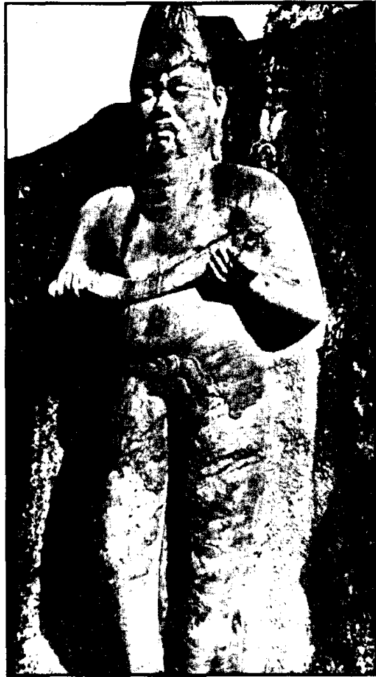
พระเจ้าปราคัมภพมหาราช

อาณาจักรที่พระเจ้าปราคัมภพพาหุ ที่ ๑ ทรงยึดครองได้แห่งแรก คือ โปลอนนารูวะ จากโปลอนนารูวะ จึงเคลื่อนพลเข้าโจมตีแคว้นอื่น ๆ ที่ต่างตั้งตนเป็นอิสระไม่ขึ้นแก่กัน ทรงได้ชัยชนะเหนือเกาะลังกาทั้งหมด ในปี พ.ศ. ๑๖๙๘ อาณาจักรโรหณะที่กำลังรุ่งเรืองและยิ่งใหญ่ในยุคนั้นก็ต้องตกอยู่ในอำนาจของพระองค์โดยสิ้นเชิง