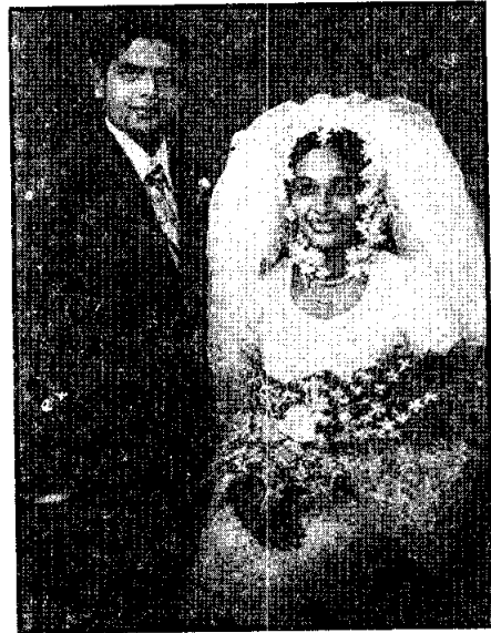
ชาวสิงหลปัจจุบัน