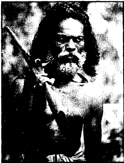
ชนเผ่าเวทะในปัจจุบัน

ต่อมา ได้มีการขุดพบกระดูกของมนุษย์เพศชาย รูปร่างสูง ๕ ฟุต ๑๐ นิ้วครึ่ง และโครงกระดูกเพศหญิงสูง ๕ ฟุต ๕ นิ้ว สันคิ้วหนา และกว้าง เพดานปากกว้าง กรามใหญ่ มีรอยชำรุดจากการเคี้ยวปรากฏอยู่ เครื่องใช้ของชนเผ่านี้เป็นของหลายสมัยรวมกัน มีทั้งหินอย่างหยาบ และหินที่ขัดเกลาร้อยคดี