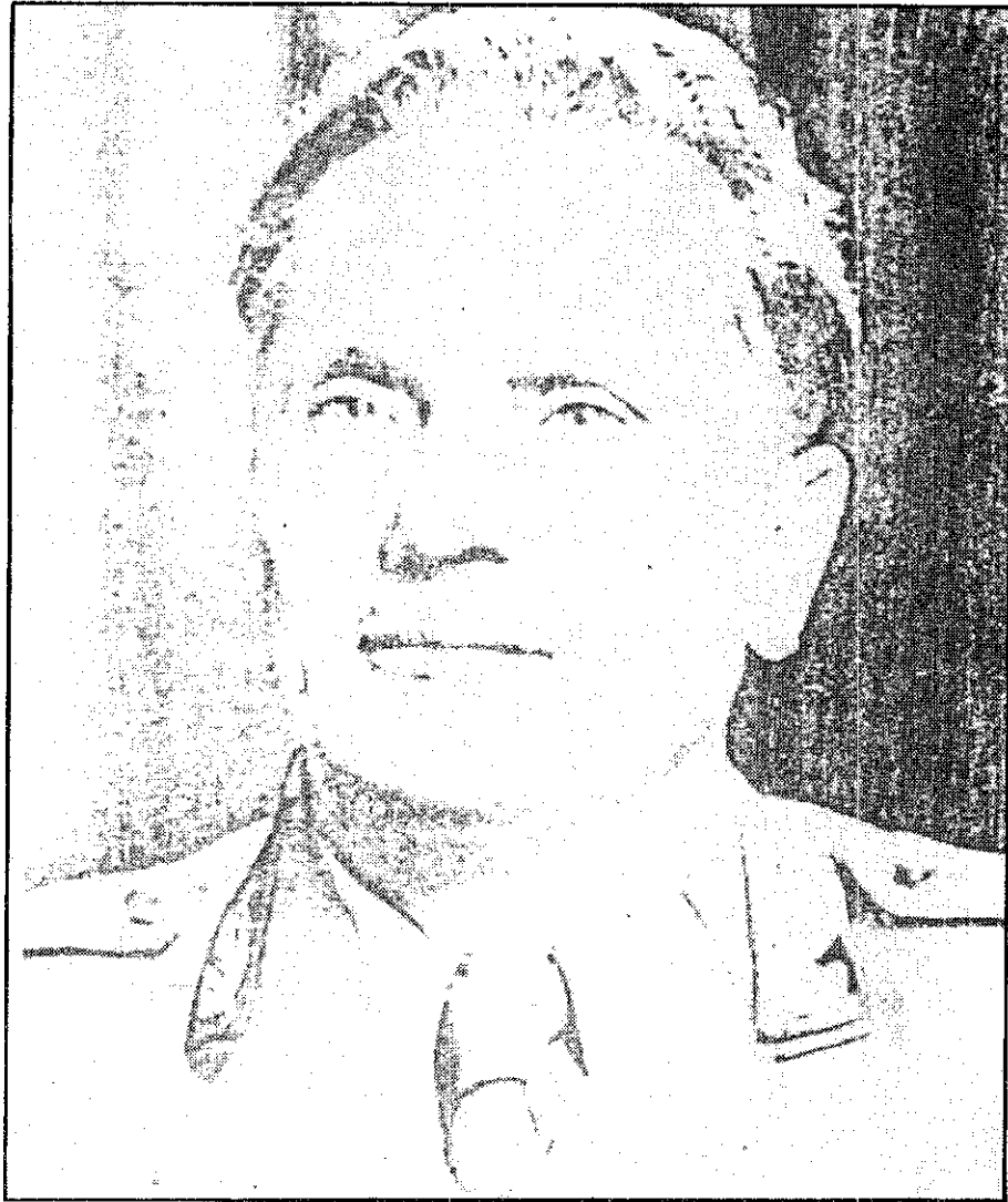
จอมพลโจชิวิ บรอก ดีโต

“คณะประธานาธิบดี” (State Presidency) ไว้ในรัฐธรรมนูญฉบับปี ค.ศ. 1975 หลักการสำคัญคือประธานาธิบดีจากรัฐทั้งหกและมณฑลอิสระทั้งสองมีสิทธิเท่าเทียมกันที่เข้าดำรงตำแหน่งประธานาธิบดีของประเทศ โดยหมุนเวียนเปลี่ยนกันไปทุก 1 ปี