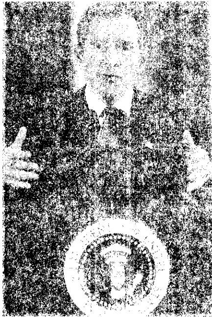
เจ้าอาวาสใหม่-ประธานาธิบดี สอน ดันบุญ บูชา แสงฟ้าเป็นเจ้าเมืองชาว กอ ยาน โศภณรัตน์ "อานันท์" เจ้าผู้ปกครอง บ้านเมืองใหม่