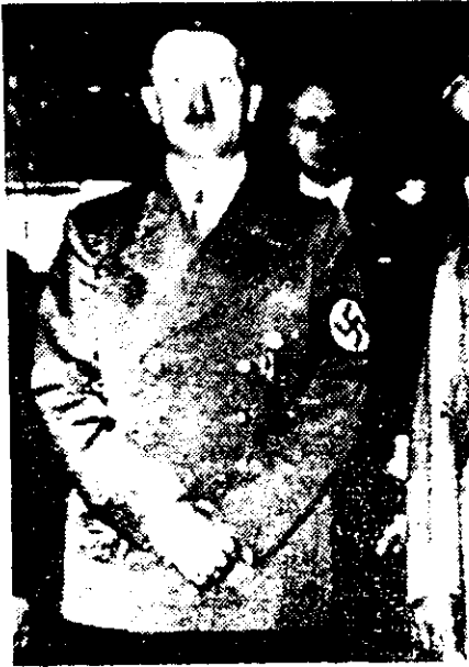
อดอล์ฟ ฮิตเลอร์