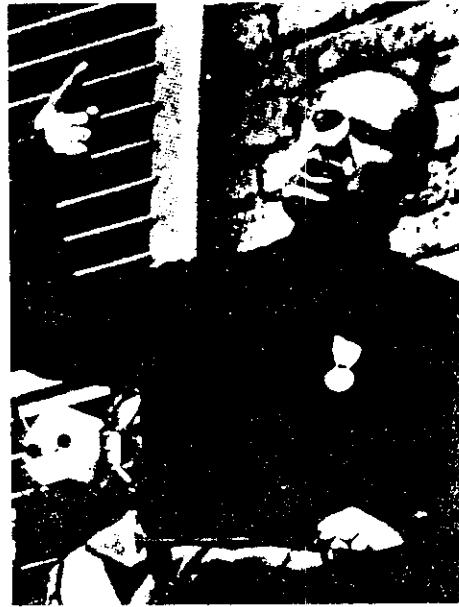
เบนิโต มุสโสลินี

ลัทธิชาตินิยม (Nationalism) หมายถึง ลัทธิหรือความเชื่อถือเชื้อชาติเป็นใหญ่ ลัทธิชาตินิยมไม่ใช่ลัทธิทางการเมือง ไม่ใช่ลัทธิทางเศรษฐกิจ แต่เป็นสภาวะของความคิดและความรู้สึกของคน ของกลุ่มคนที่มีความรักชาติของตนเองอย่างมากและรุนแรง จนในบางกรณีอาจจะมีความรักชาติแบบคลั่งไคล้ ดังนั้น ลัทธิชาตินิยมไม่มีหลักการเฉพาะ หรือมีรูปแบบเป็นที่แน่นอน