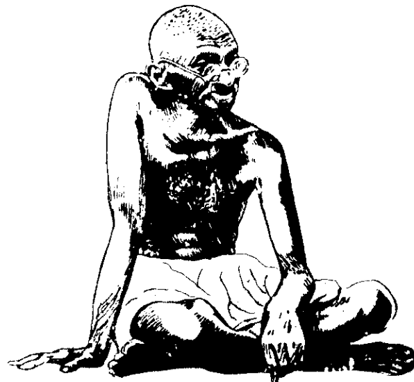
มหาตมะคานธี แสดงเอกลักษณ์ของความเยือกเย็น ไม่สันติ ความเป็นสามัญชน

ตัวอย่างของลัทธิเชื่อถือบูชาตัวบุคคลที่มีผลกระทบต่อ การเปลี่ยนแปลงทางสังคม และการเมือง ได้แก่ ลัทธิคานธี ลัทธิฟาสซิสต์ (Fascism) และลัทธินาซี (Nazism) "บุคคล" ผู้จะเป็นผู้นำกระแสความคลั่งไคล้ของมวลชนได้จะต้องมีลักษณะพิเศษที่เรียกว่า บารมี (Charisma) ในตัวเอง ดังจะเห็นได้จากบุคคลผู้นำของลัทธิดังที่กล่าวมา ได้แก่ คานธี มุสโสลินี และฮิตเลอร์ ตามลำดับ