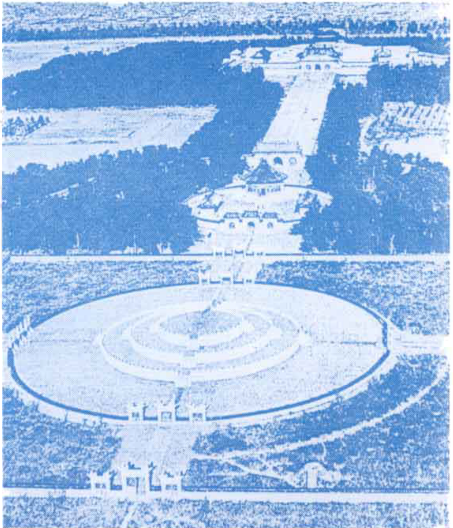
PLATE 9. The round Altar of Heaven on its triple terrace, where the emperor performed rites. Beyond it is the "Temple of Heaven." At the far end of the axis stands the three-storied, round "Temple for Praying for a Good Harvest," which is popularly known as the "Temple of Heaven." To the north of the temple compound lies the city of Peking.