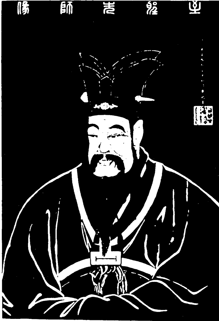
รูปที่ 2 ปรมาจารย์ขงจื้อ