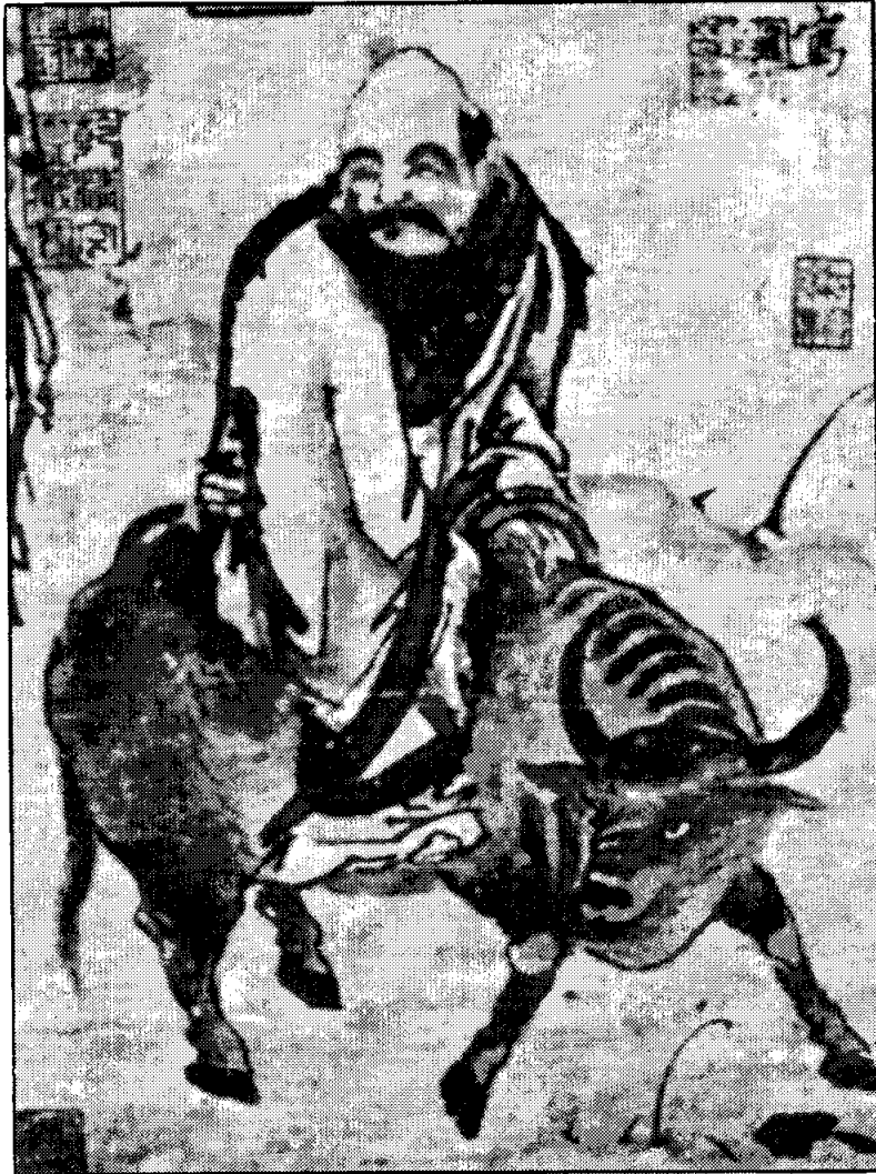
รูปที่ 5 เล่าจื่อ บนหลังควาย