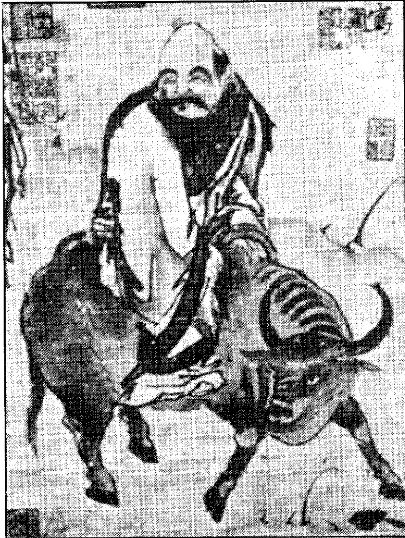
เล่าจื้อ บนหลังควาย