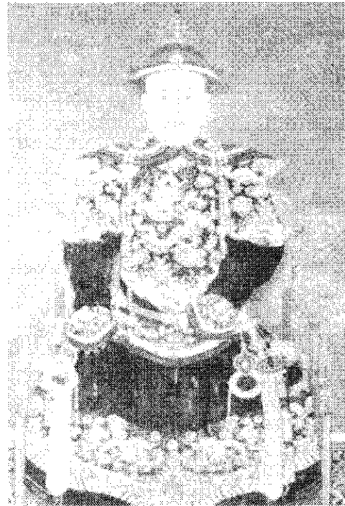
4. Emperor Ch'ien-lung (1736-1795)