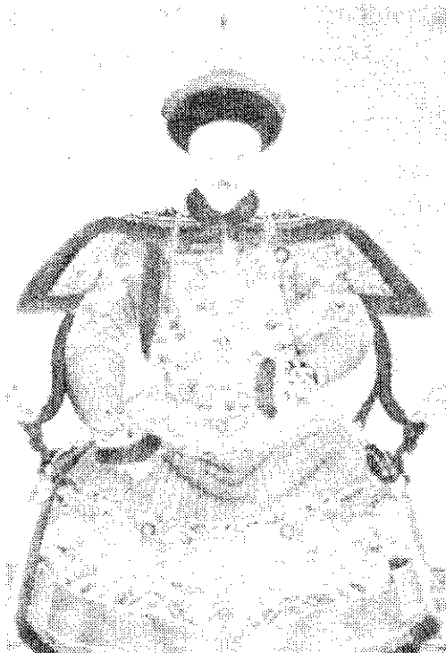
3. Emperor Yung-cheng (1723-1735)