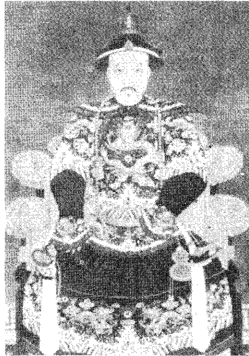
2. Emperor K'ang-hsi (1662-1722).