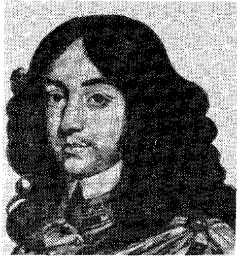
พระเจ้าชาร์ลส์ที่ 2

สภาพเศรษฐกิจ ค.ศ. 1660 ระบบพาณิชย์นิยมเห็นรูปร่างชัดเจนในอังกฤษซึ่งได้อิทธิพลมาจากโคลแบร์ แต่นโยบายการค้าแบบพาณิชย์นิยมของอังกฤษมิได้เกิดจากทฤษฎีแบบของฝรั่งเศส อังกฤษให้ความสนใจในจุด ๆ เดียวคือการค้าต่างประเทศ โดยให้การสนับสนุนแต่ก็ยังไม่มั่นคงเพราะขึ้นอยู่กับการค้าผ้าขนสัตว์เพียงอย่างเดียว และพาณิชย์นาวียังอ่อนแอมาก พ่อค้าอังกฤษต้องการการคุ้มครองให้พ้นจากการแข่งขันของชาวดัตช์สินค้าหลักของอาณานิคมของอังกฤษได้แก่ น้ำตาลและยาสูบซึ่งเป็นที่ต้องการอย่างมากของชาวยุโรป สินค้าเหล่านี้อังกฤษสามารถนำเข้าเมืองท่าของตนได้โดยตรง และพ่อค้าอังกฤษยังเป็นผู้ป้อนสินค้าที่ชาวอาณานิคมต้องการ พ่อค้าจึงเปลี่ยนสภาพมาเป็นคนกลางในการค้าเช่นเดียวกับดัตช์