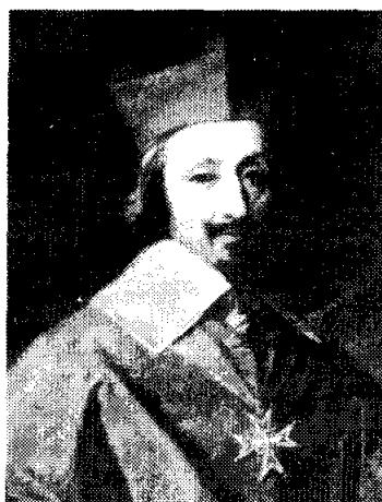
สังฆราชริเชอลิเออ

สังฆราชริเชอลิเออ (ค.ศ. 1585 - 1642) เข้ารับตำแหน่งอัครมหาเสนาบดีในปี ค.ศ. 1624 และได้ดำรงตำแหน่งหัวหน้าคณะรัฐบาลไปจนถึงชีวิต ริเชอลิเออเข้ารับตำแหน่งเสนาบดีในปีที่ทุกคนคาดว่า ฝรั่งเศสจะเข้าสู่ยุคสงครามศาสนา แต่ผลปรากฏว่า 18 ปี ภายใต้การดำเนินงานของริเชอลิเออเป็นระยะแห่งความยิ่งใหญ่ระยะหนึ่งในประวัติศาสตร์ฝรั่งเศส ท่านผู้นี้จะเป็นผู้วางโครงการต่าง ๆ ที่ฝรั่งเศสจะรับไปดำเนินการต่อไปอีกประมาณ 150 ปี และริเชอลิเอออีกเช่นเดียวกันได้เป็นผู้ก่อตั้งสิ่งที่เรียกว่าระบบเก่า (The Ancient Régime) ซึ่งเป็นระบบสังคมและการเมืองสมัยพระเจ้าหลุยส์ที่ 14 และ 15 และอยู่มาจนถึงสมัยการปฏิวัติใหญ่ ปี ค.ศ. 1789 ริเชอลิเออไม่ใช่คนหัวสมัยใหม่ เขายึดถือในทฤษฎีการเมืองแบบเก่าของคริสต์ศตวรรษที่ 16 กล่าวคือ มีความเป็นว่าผู้ปกครองควรจะมีลักษณะเช่นที่มาเคียเวลลีว่าคไว์ในหนังสือ The Prince ริเชอลิเออเชื่อว่าถ้ารัฐบุรุษมีความล้มเหลว ไม่เข้มแข็งหรือมีความเมตตาจะต้องประสบชะตากรรมในวันหนึ่ง ความพิศชอบชั่วดีในแง่ศีลธรรมใช้ควบคุมตัวบุคคลได้แต่จะนำมาใช้กับรัฐไม่ได้ โดยเฉพาะอย่างยิ่งต่อสภาพของประเทศฝรั่งเศสในคริสต์ศตวรรษที่ 17 ริเชอลิเออเห็นว่าบรรดาขุนนางมีอำนาจมากเกินไป รัฐบาลที่เข้มแข็งเด็ดขาดเท่านั้นที่สามารถยับยั้งความหายนะที่จะเกิดขึ้นได้