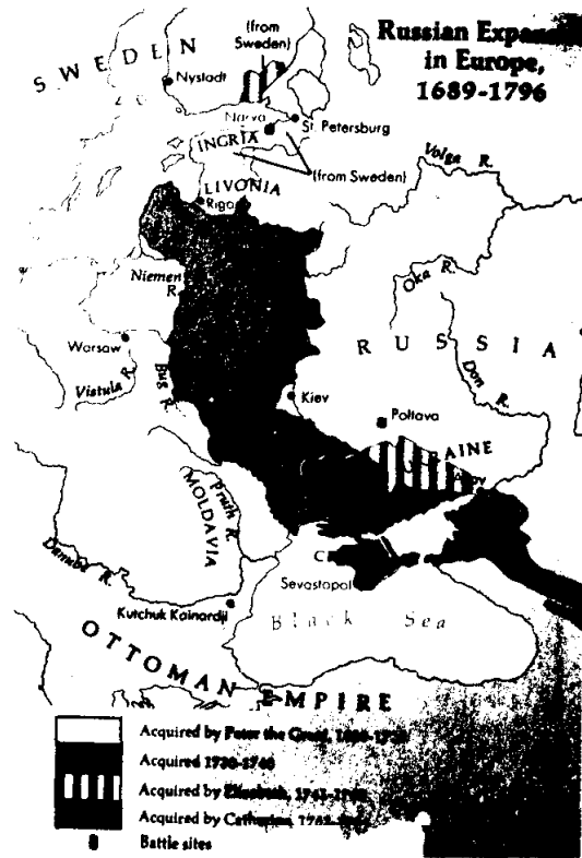
การขยายดินแดนของอาณาจักรรัสเซีย ค.ศ. 1689-1796

ศาสตร์ของชนเผ่าสลาฟปอนอยู่มากก็จริง แต่มันได้ทำให้ความคิดของมนุษย์หยุดยั้งลงแต่ประการใด