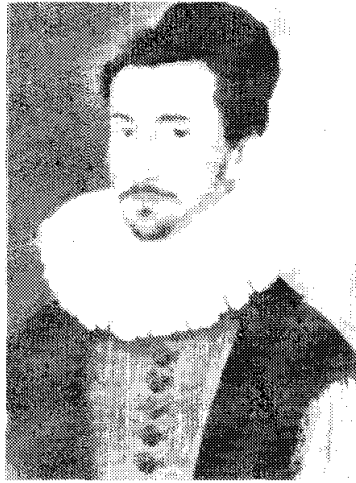
เซอวังเตส์

ผู้นั้นแท้จริงแล้วเป็นชาวนาเท่านั้น แต่ คอน กิโฮเต้ ก็ได้สู้เพื่อรักษาเกียรติของเธอจนถึงชีวิต นั่นคือจุดมุ่งหมายของการเสียดสีสังคม สุดท้ายการต่อสู้กับยักษ์หรือที่จริงคือกัณฑ์ลมนที่ คอน กิโฮเต้ ต่อสู้ด้วยนั้นเป็นการต่อสู้กับสิ่งที่ไม่มีตัวตน