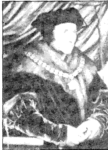
เซอร์ โทมัส มอร์

เซอร์โทมัส มอร์ (Sir Thomas More ค.ศ. 1478 - 1535) เป็นนักมนุษยนิยมของ อังกฤษที่สำคัญที่สุด อดีตเป็นนักกฎหมายและเคยดำรงตำแหน่งสำคัญ ๆ ในหน้าที่ราชการ หลายตำแหน่ง เช่น เป็นประธานสภาสามัญ และยังได้รับแต่งตั้งเป็นอัครเสนาบดีของอังกฤษ ในปี ค.ศ. 1529 อีกด้วย ความคิดมนุษยนิยมของมอร์แสดงออกมาในรูปของการเมือง ซึ่ง ปรากฏในหนังสือ Utopia (ยูโทเปีย) พิมพ์ปี ค.ศ. 1516 หนังสือเล่มนี้เขียนเป็นภาษาละติน แสดงถึงความคิดเกี่ยวกับรัฐในอุดมคติ Utopia ในภาษากรีกแปลว่า “Nowhere” ตามเนื้อ เรื่อง ยูโทเปียเป็นเกาะลึกลับอยู่ในโลกใหม่ เป็นเกาะที่สังคมเป็นเจ้าของทรัพย์สินสมบัติทุกชิ้น