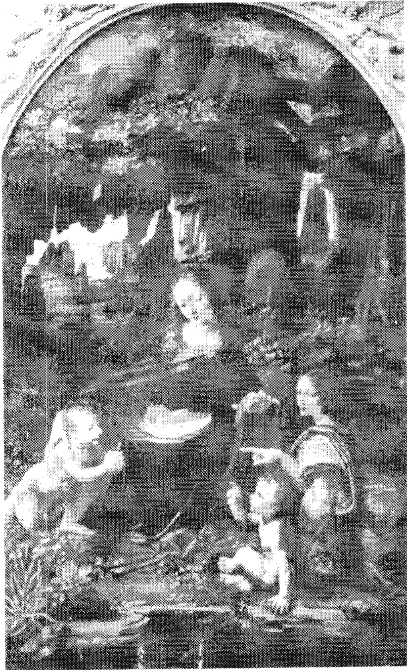
ลีโอนาร์โด ดา วินชี "The Madonna of the Rocks"

ความประณีตนุ่มนวลในรายละเอียด ต่อมาเมื่อไปพบงานของไมเคิลแองเจโลเข้า ก็เกิดความ นิยมชมชอบภาพที่เคยเขียนนุ่มนวลก็เพิ่มลักษณะแข็งกร้าวขึ้น