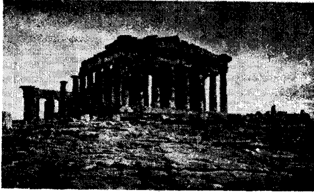
PARTHENON FROM WEST