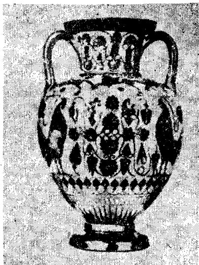
BLACK FIGURE VASE

สีแดงที่เหมาะสมสำหรับการทำเครื่องปั้นดินเผา โดยเฉพาะอย่างยิ่งต่อจากสมัยของโซลอนแล้วการอุตสาหกรรมประเภทนี้ก็ได้มีการพัฒนาเป็นอย่างดีรวมถึงการวาดภาพซึ่งพลอยเจริญควบคู่กับอุตสาหกรรมประเภทนี้ด้วย เริ่มจากการวาดภาพบนเหยือกใช้สีดำก่อน ต่อมาก็วาดเป็นรูปหน้าคนบ้างหรือรูปสิ่งของอื่น ๆ ให้สีดำตัดกับสีแดงของสีเหยือก เหล่านี้เดิมก็ใช้สำหรับใส่น้ำมันโอสฟ ต่อมาก็มีแก้วเครื่องดื่มและแก้วสำหรับผสมอื่น ๆ เริ่มมีการวาดภาพตามแพชชั่น ช่วงปี 520 นั้น กลับนิยมการใช้พินสีดำสนิท แล้ววาดภาพเด่นออกมา นักวาดก็นิยมการเซ็นชื่อตนเองกำกับจุดประสงค์ในการตกแต่งสีสันในขั้นต้นนี้ก็คือการใช้ภายในครัวเรือน แต่ต่อมาเมื่อมีความชำนาญมากขึ้นก็มีการตกแต่งเพิ่มเติมโดยมุ่งความงามด้วยแบบที่ใช้สีแดงก้าวหน้ามากในตอนกลางศตวรรษที่ 5 แต่เมื่อประมาณปี 540 เป็นต้นมาเครื่องถ้วยชามแอตติคก็กลายเป็นที่นิยมถึงกับส่งออกไปจำหน่ายต่างประเทศ ดินแดนที่รับซื้อก็คือเอเธนส์ กรีซ แมกนา กราเซีย อียิปต์ และดินแดนตอนใต้ของรัสเซีย การค้าขายดังกล่าวนี้มีผลให้เอเธนส์เปลี่ยนฐานะไปอย่างรวดเร็วไปเป็นชุมชนที่ก้าวหน้าที่สุดในด้านการค้า แม้แต่คอร์ินท์ซึ่งมีชื่ออยู่ก่อนในการค้าขายเครื่องถ้วยชามกับดินแดนตะวันตก