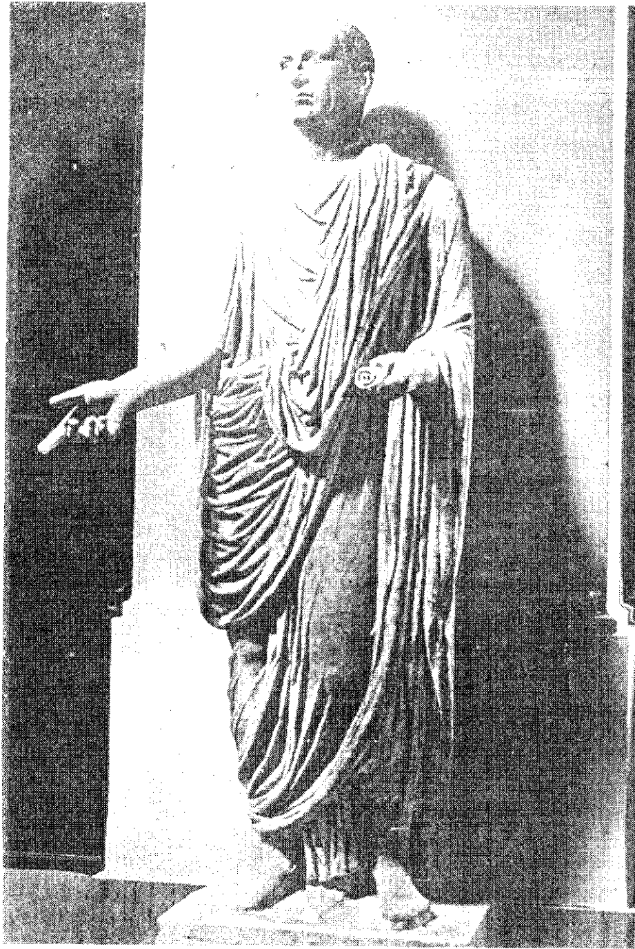
ซีซาร์ : รัฐบุรุษ